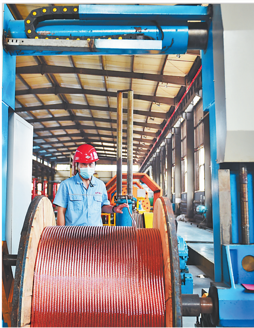
▲日前,位于宁晋县的邢台鑫晖铜业特种线材有限公司工人在加工高铁专用线缆。该公司是国家电气化铁路与城市轨道交通接触网材料的专业生产厂家,在接触网导线领域处于国际领先水平。 ▲俯瞰宁晋县玉峰实业集团大健康生物产业园。作为农业产业化国家重点龙头企业,这里的维生素B12产能连续多年占据全球市场70%份额。