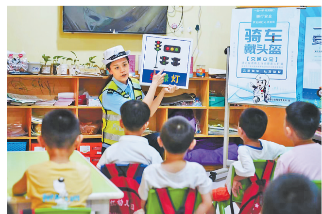
日前,巨鹿县交警大队民警在金玉庄村聪明树幼儿园向孩子们普及交通安全知识。今年以来,邢台市公安局交警支队组织各县(市、区)交警部门民警走进村庄、社区,重点对“一老一小”群体开展面对面宣传,提升他们的尊法守法意识,以防范和减少交通事故发生。

今年以来,邢台在生活、就业、住房等多个方面为退役军人和其他优抚对象提供优先优待服务,享受其他社会救助后仍有特殊困难的退役军人和烈士遗属、因公牺牲军人遗属、病故军人遗属可申请关爱退役军人基金会资助;辅警岗位同等条件下优先招录退役军人;公办养老机构优先接收老年退役军人;全市有17个景区免收退役军人门票等。上半年全市累计优惠优待军人军属和退役军人2003人次。