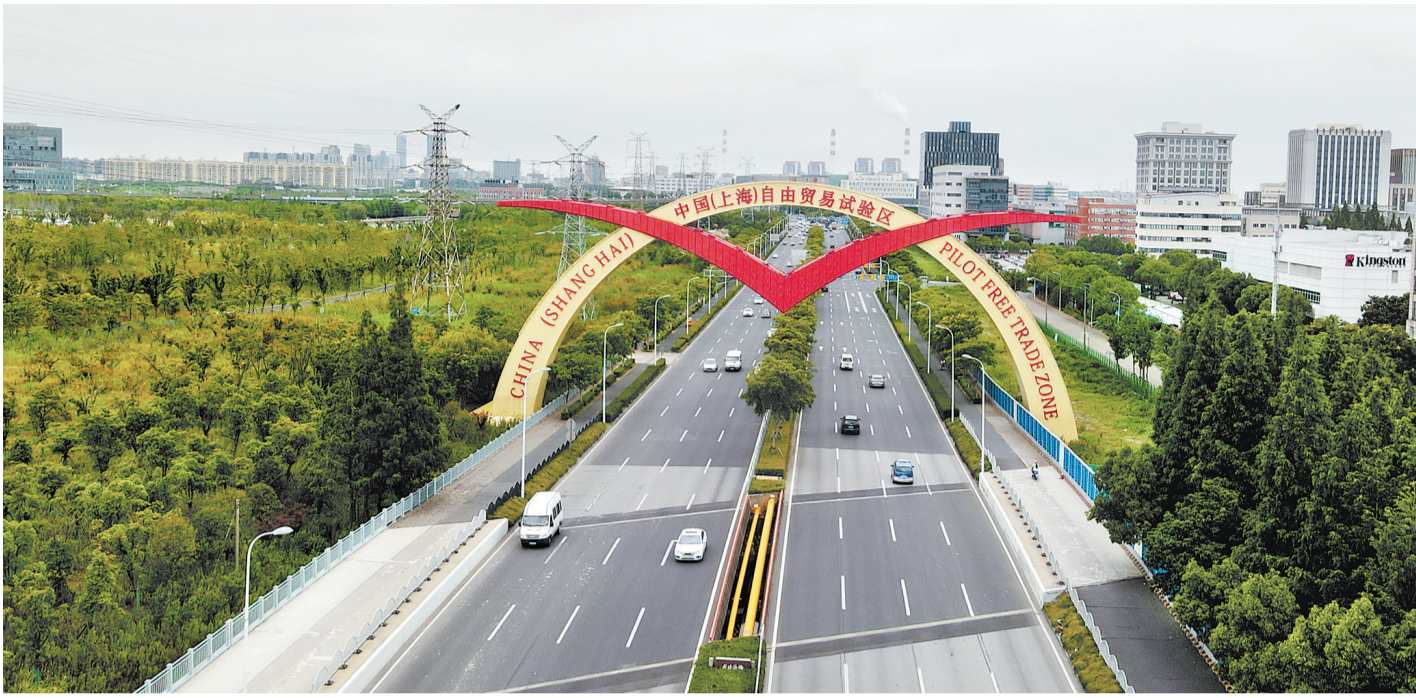
这是位于上海外高桥保税区的中国(上海)自由贸易试验区标志“海鹰门”。(资料片)

防疫疫情就是为了解经济、保民生。7月25日,习近平总书记在在外人士座谈会上强调:“全面落实疫情要防住、经济要稳住、发展要安全的要求是一个整体,要一体认识、一体落实、一体评估,巩固经济回升向好趋势,力争实现最好结果。”