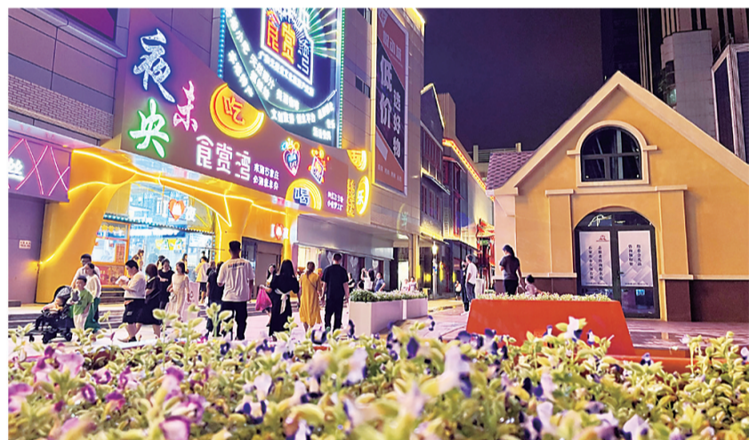
▲夜色中的湾里庙步行街人头攒动,流光溢彩。