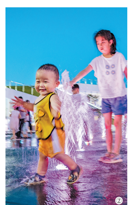
衡水市不断推进商业步行街、夜经济街区建设,市内多个商圈的客流和营业额显著提升。入夜,越来越多的市民走出家门,尽享夏夜的浪漫和繁荣。 ①市民在位于衡水主城区的上海公馆·71街区“潮流夜市”休闲购物。 ②孩子们在上海公馆·71街区“潮流夜市”广场嬉戏玩耍。