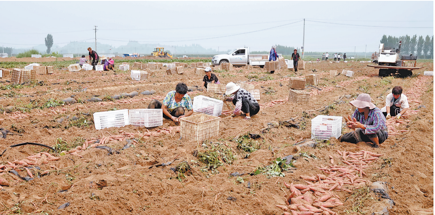
卢龙 鲜食红薯收获忙