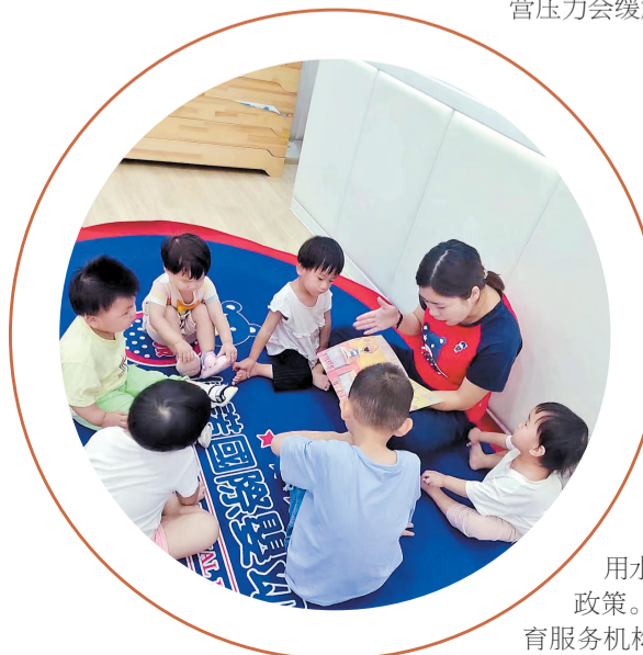
邢台佳诺婴幼儿照护中心内,孩子们正在听故事。