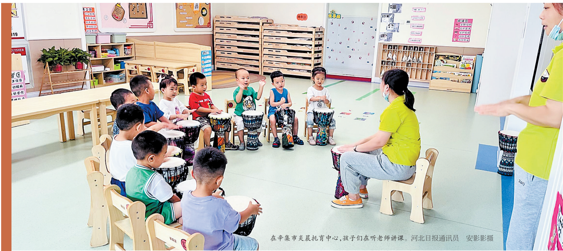
在辛集市炎晨托育中心,孩子们在听老师讲课。