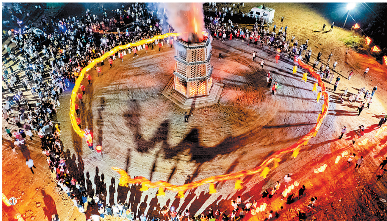
①9月10日，在湖南省汨罗市新市镇，居民举行“中秋耍宝塔”民俗活动(无人机照)。当日是中秋佳节，各地市民走出家门，参加各类活动，度假。