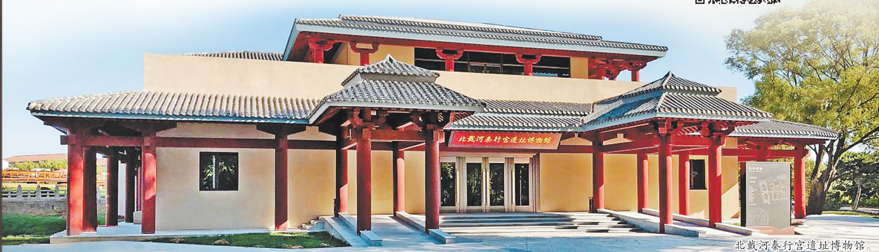
北戴河秦行宫遗址博物馆。

中华文化延续着我们国家和民族的精神血脉，既需要薪火相传、代代守护，也需要与时俱进、推陈出新。要自菲薄或者吹毛求疵，并不能使我们更有信心地立于世界民族之林。只有对自己身后悠久灿烂的传统充满敬仰，真诚守护，我们的文化自信才能更加坚定。因此，找到传统文化和现代生活的连接点，推动中华优秀传统文化创造性转化、创新性发展，舞台上的“国潮风”才会长盛不衰，最终汇聚起推动民族和历史向前发展的力量。