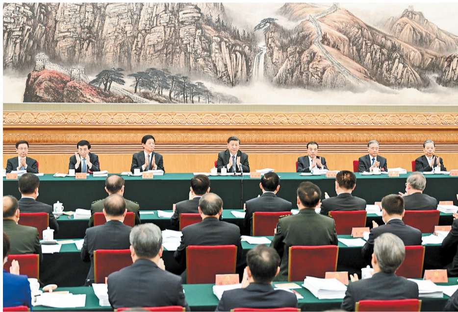
10月18日,中国共产党第二十次全国代表大会主席团在北京人民大会堂举行第二次会议。习近平、李克强、栗战书、汪洋、王沪宁、赵乐际、韩正等出席会议。