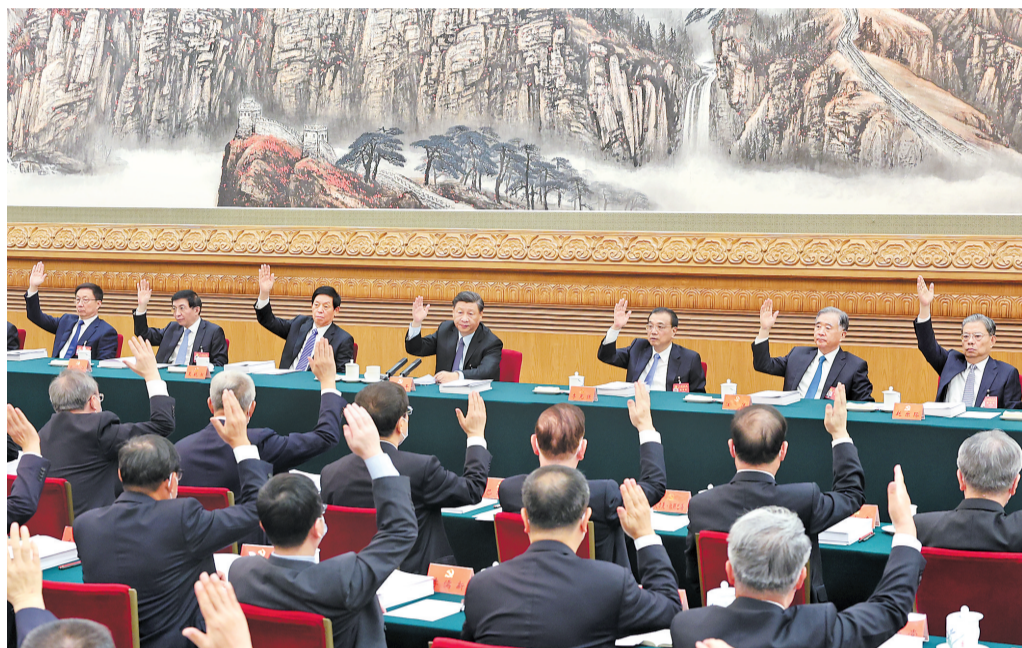
10月21日，中国共产党第二十次全国代表大会主席团在北京人民大会堂举行第三次会议。习近平、李克强、栗战书、汪洋、王沪宁、赵乐际、韩正等出席会议。