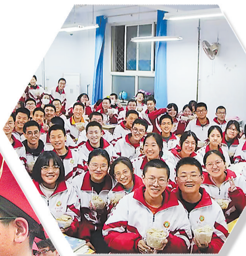
▼冬至日免费的饺子