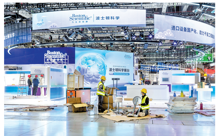
10月31日，工作人员在布置展位。

据新华社上海11月1日电（记者周蕊、谢希瑶）记者从1日举行的第五届中国国际进口博览会上了解到，本届进博会共有145个国家、地区和国际组织参展，284家世界500强和行业龙头参加企业商业展。