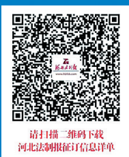
请扫描二维码下载河北法制报征订信息单

注：“收报信息”一栏，向单位投递请在单位名称后标注“收发室”，订阅多份且需不同地址收报的，收报地址和该地址对应投递份数可在第11项中依次列举。