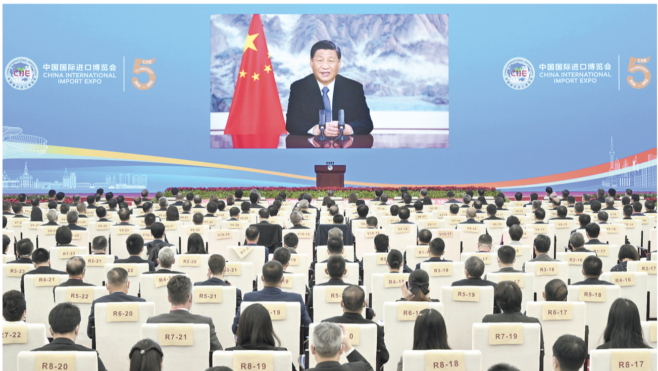
11月4日晚,国家主席习近平以视频方式出席在上海举行的第五届中国国际进口博览会开幕式并发表题为《共创开放繁荣的美好未来》的致辞。

新华社北京11月4日电 11月4日晚,国家主席习近平以视频方式出席在上海举行的第五届中国国际进口博览会开幕式并发表题为《共创开放繁荣的美好未来》的致辞。(致辞全文见第二版)