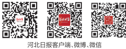
河北日报客户端、微博、微信