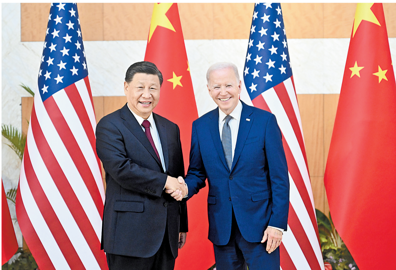
当地时间11月14日下午,国家主席习近平在印度尼西亚巴厘岛同美国总统拜登举行会晤。

新华社印度尼西亚巴厘岛11月14日电(记者白林、倪四义、刘华)当地时间11月14日下午,国家主席习近平在印度尼西亚巴厘岛同美国总统拜登举行会晤。两国元首就中美关系中的战略性问题以及重大全球和地区问题坦诚深入交换了看法。