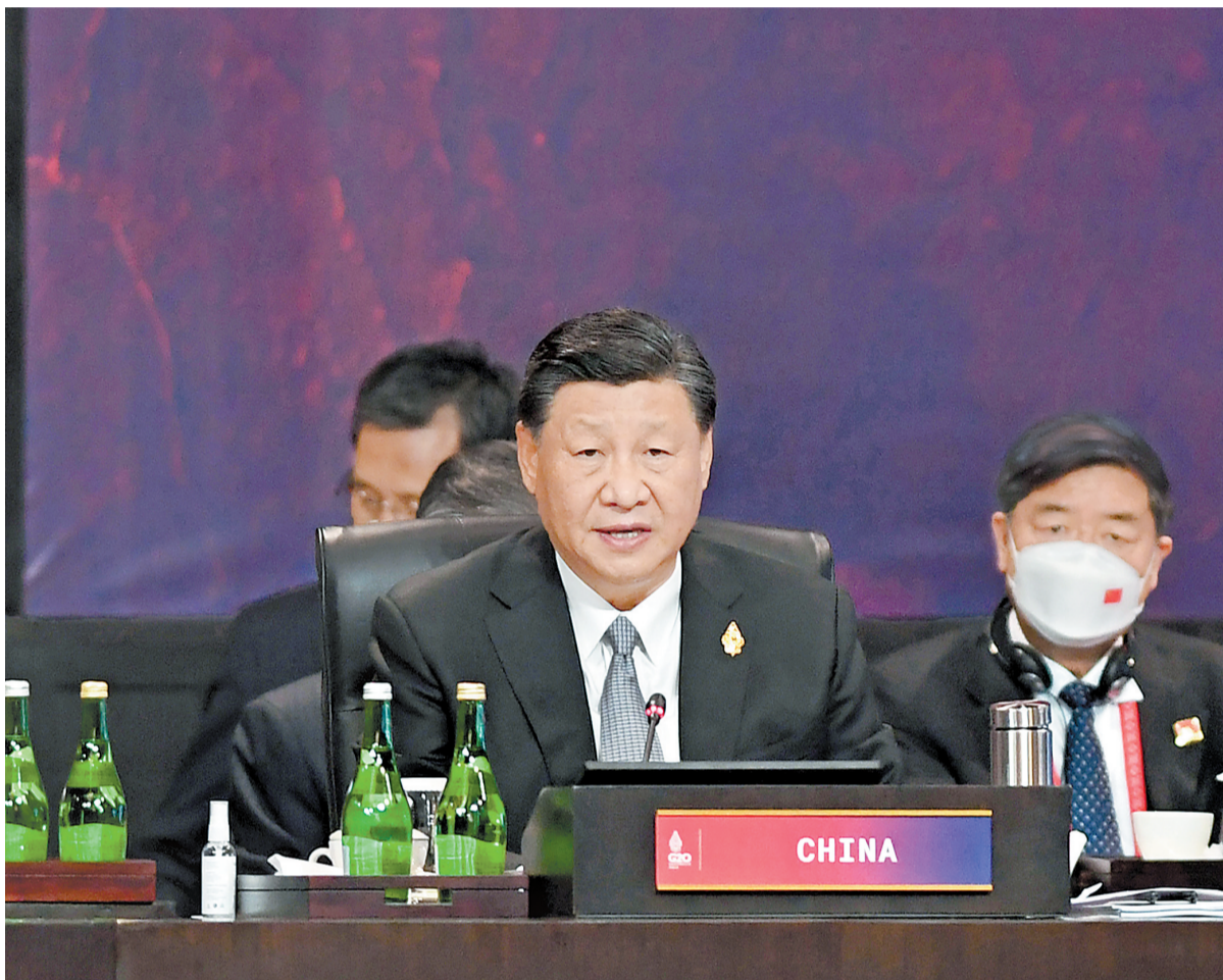
当地时间十一月十六日，二十国集团领导人第十七次峰会在印度尼西亚巴厘岛继续举行。国家主席习近平出席并发言。