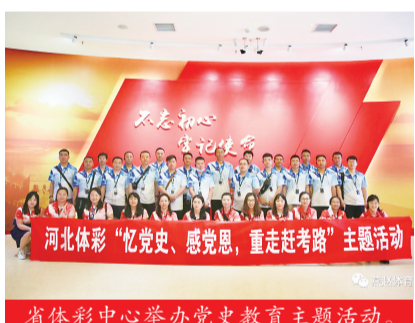
省体彩中心举办党史学习教育主题活动。