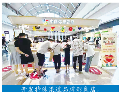
开发特殊渠道品牌形象店。

河北体彩推动渠道协同发展,试点特殊渠道开发拓展,全年实现了12个特殊渠道品牌形象店落地运营;规范实体店建设,提升实体店形象建设水平;面向社会公开邀约社会各界人士加入体彩销售行列,全省12个市级中心在河北体彩网统一发布各区域邀约公告;升级热敏纸审批流程,提高配送效率。