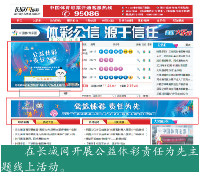
在长城网开展公益体彩责任为先主题线上活动。