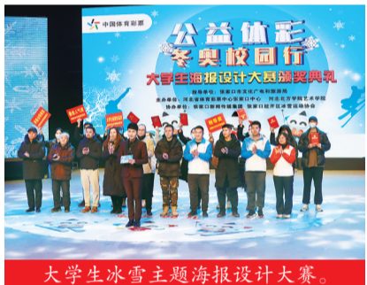
大学生冰雪主题海报设计大赛。