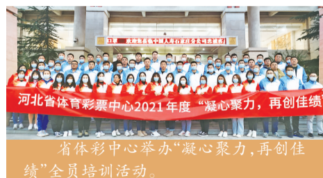
河北省体彩中心2021年度“凝心聚力,再创佳绩”全员培训活动。

重视员工基本权益的保障,依法与员工签订劳动合同,组织开展“凝心聚力,再创佳绩”全员培训活动,员工参训比例达100%。