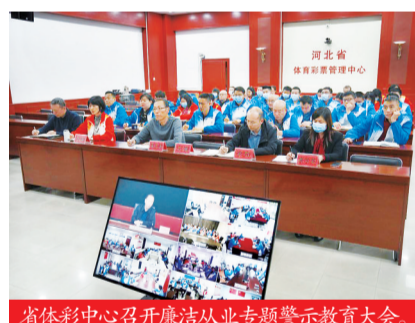
省体彩中心召开廉洁从业专题警示教育大会。

河北体彩坚持以开展党史学习教育为重点,积极创新活动载体和方式方法,组织开展内容丰富的主题党日,先后举办了“中国共产党党史双周大课堂”活动、“永远跟党走·唱支山歌给党听”网络歌咏比赛等活动,并打造了“党史学习教育宣传廊”和建党100周年文化墙,设置党史学习教育宣传标语,提升党史学习教育宣传效果。切实推进体育彩票领域党风廉政建设,开展体彩从业人员廉洁从业警示教育,提升体彩队伍的廉洁意识、风险意识。2021年,中心未发生重大违法违规违纪事件。