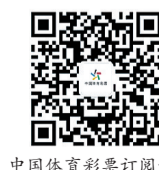
中国体育彩票订购号