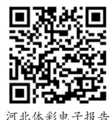
河北体彩电子报告