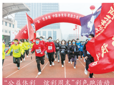
“公益体彩 炫彩周末”彩色跑活动。

2021年,河北体彩在邯郸武安市九龙山矿山生态修复公园组织开展“公益体彩 炫彩周末”彩色跑活动,旨在深刻诠释绿水青山就是金山银山理念,助力全民健身,此次活动共有近500名社会各界的群众参与。