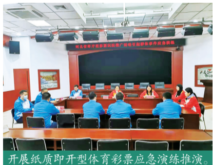
开展纸质即开型体育彩票应急演练推演。

为巩固安全基础,河北体彩落实推进网络安全建设,制定了网络安全管理制度,加强网络安全检查,更新维护软硬件设施,提升安全防护能力;制定突发事件应急预案,规范应急处置流程,提高应对危机的处置能力。