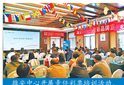
雄安新区开展责任彩票培训活动。

河北体彩不断优化责任彩票组织治理,制定了《河北省体育彩票中心责任彩票建设体系规范(试行)》,规范责任彩票管理;开展市级体彩机构评优工作,制定了《2021年度河北省地市级体彩机构工作评估方案》,提升责任彩票建设成效;重视责任彩票能力培养,开展全省线下责任彩票培训总数为323次,参训人员数量为9797人;开展了《责任彩票理性购彩及责任彩票社会影响力研究》研究项目,积极探索体育彩票市场销售及市场服务工作。