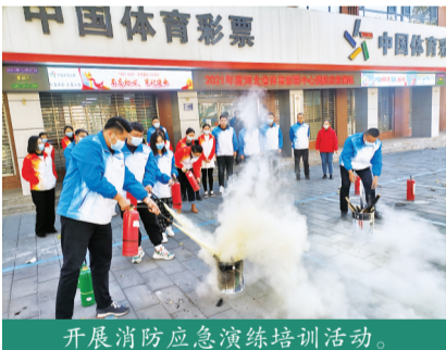
开展消防应急演练培训活动。