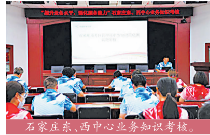
石家庄东、西中心业务知识考核。

不断提升专管员业务知识和水平,2021年专管员参培比例达到100%;完成全省代销合同电子化换签工作,为偏远地区代销者及身体行动不便代销者提供上门合同换签服务;组织举办“2021年百佳优秀代销网点评选活动”,带动全省体彩代销网点公益形象的整体提升。