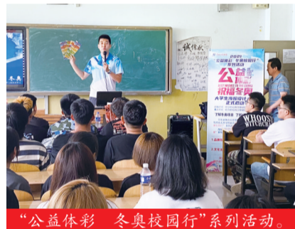
“公益体彩 冬奥校园行”系列活动。

为建设体育强国,河北体彩大力支持河北群众性冰雪运动纵深发展,赞助支持了“河北体育消费季”活动,带动了6万余人参与“冰雪大篷车”活动,开展了“公益体彩,助力冬奥”主题宣讲活动,让更多的群众参与冰雪运动;助力冰雪运动进校园,全省已有15000余所学校相继举办了校园冰雪赛事活动,实现了校园冰雪运动全覆盖;推动体彩品牌建设,在全省体彩实体店张贴冰雪主题海报,将体彩实体店开到张家口崇礼赛区的大型滑雪场,营造浓厚的冬奥氛围,宣传冬奥文化。