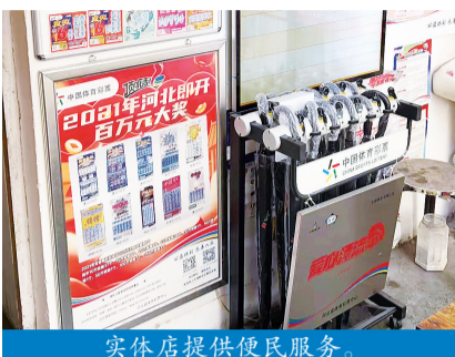
实体店提供便民服务。