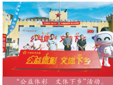
“公益体彩 文体下乡”活动。

自2018年开始,连续三年为红色根据地、特色乡村送去体彩关爱及文体帮扶,激发村民热爱体育、强身健体的兴趣和动力,活动范围覆盖石家庄、保定、张家口、承德4个市、15个县、26个行政村,惠及1万余名村民。