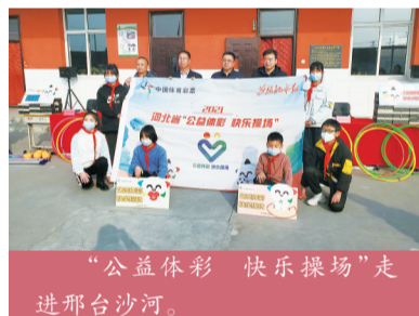
“公益体彩 快乐操场”走进邢台沙河。

2021年,河北体彩为革命老区的20所捐赠学校均配备价值大约两万元的体育器材和运动设施,改善偏远地区学校的办学条件,提升乡村中小学校的体育教育质量。