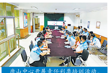
唐山中心开展责任彩票培训活动。