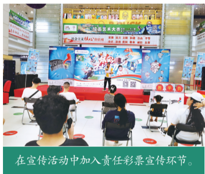
在宣传活动中加入责任彩票宣传环节。

河北体彩创新责任彩票宣传,丰富宣传渠道和形式,通过动态主题线上作品朋友圈海报、H5、体育馆大屏、省中心电子屏、网站通栏及焦点图、微博封面及焦点图、微信封面图、高频电视画面、开机电视画面等多种形式,利用户外静态传播方式及消耗品展示等多种方式,多方位传播责任彩票理念。同时还利用电影院映前广告新兴媒体的形式,在电影上映的高峰期(暑期档/国庆档/贺岁档等)对体彩的公益形象及品牌形象进行影院映前广告宣传,提升责任彩票宣传的深度和广度。