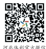
河北体彩官方微信