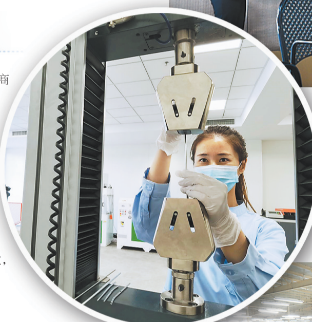
▲科技特派团成员在做丝网拉力试验