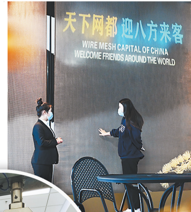
▲工作人员向客商介绍丝网产品——雨幕网

同时，该县在海外搭建了更多的丝网销售平台、仓储平台和物流渠道，设立丝网“云”工厂，并借助电商平台，积极探索“互联网+工业”模式，将信息化技