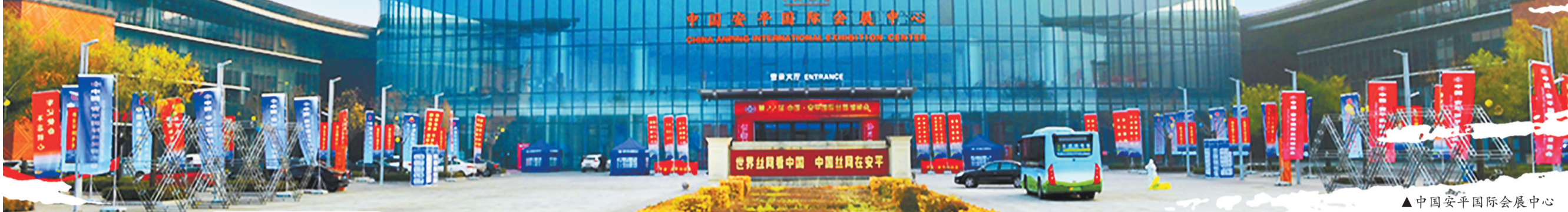
▲中国安平国际会展中心