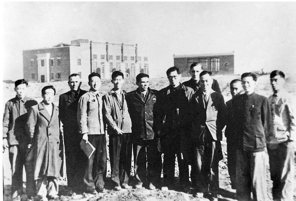
上图:1956年,江泽民同志(左七)在长春第一汽车制造厂同援建一汽的苏联专家等合影。