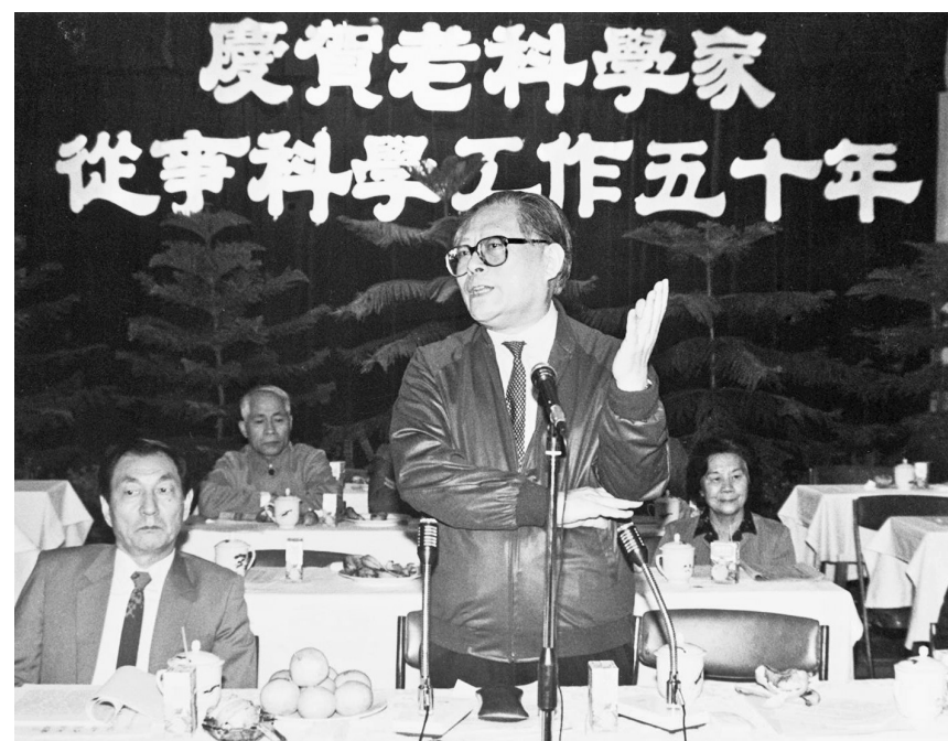
上图:1988年10月,江泽民同志在上海庆贺老科学家从事科学工作五十年座谈会上讲话。