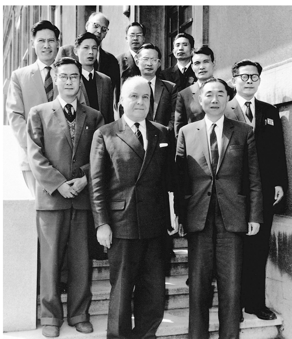
上图:1964年6月,江泽民同志(二排右一)在法国艾克斯莱班出席国际电工委员会会议期间与会代表合影。