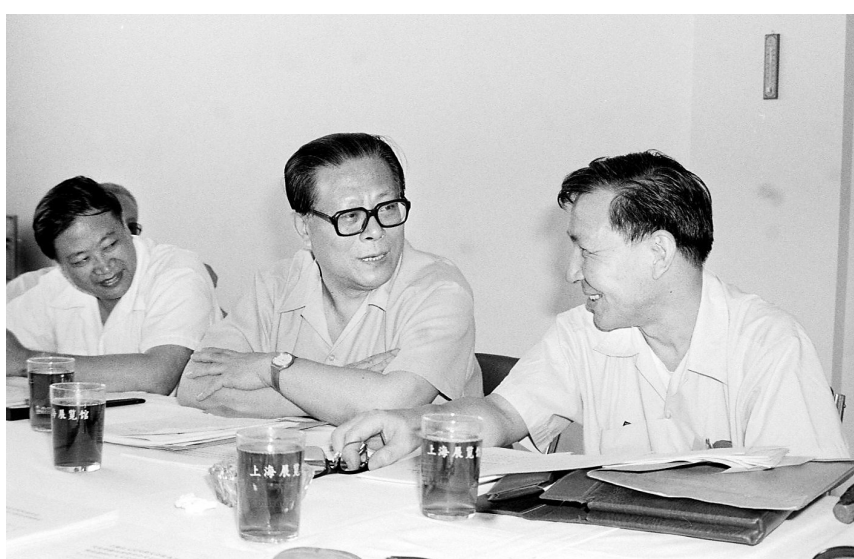
上图:1985年,江泽民同志在上海市八届人大四次会议上。