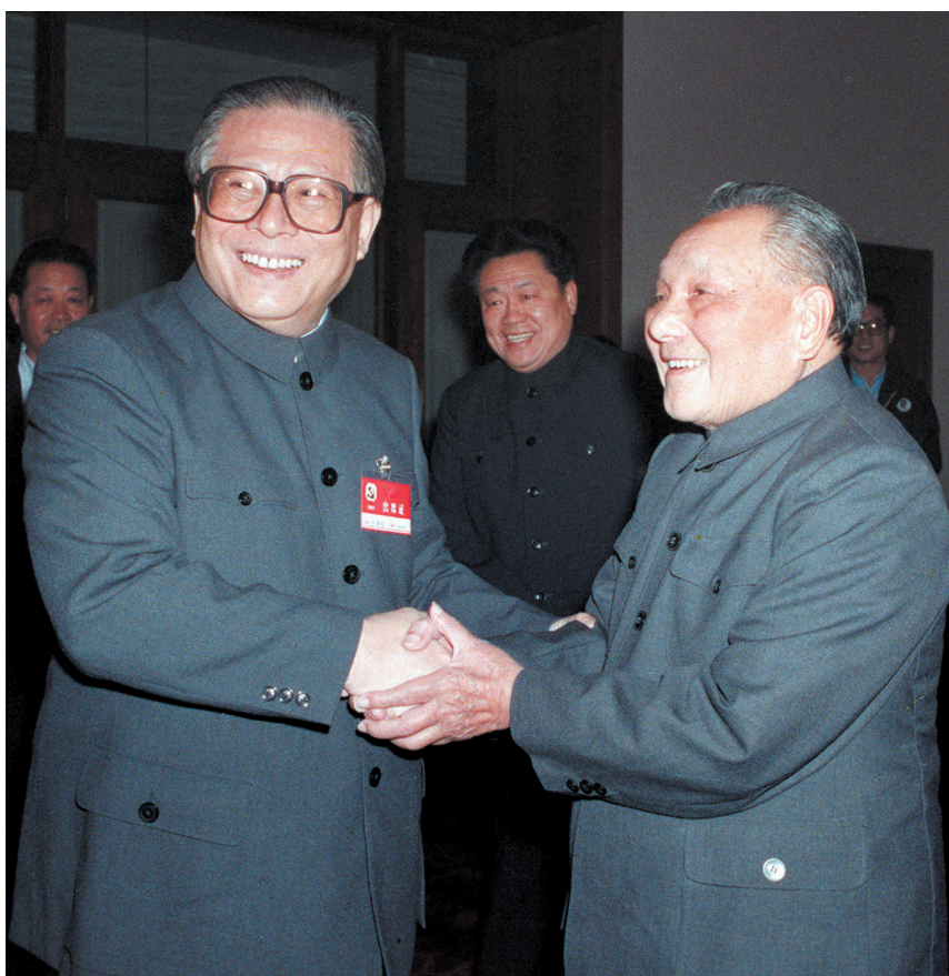
右图:1989年11月6日至9日,中国共产党第十三届中央委员会第五次全体会议在北京召开。这是邓小平同志和江泽民同志亲切握手。