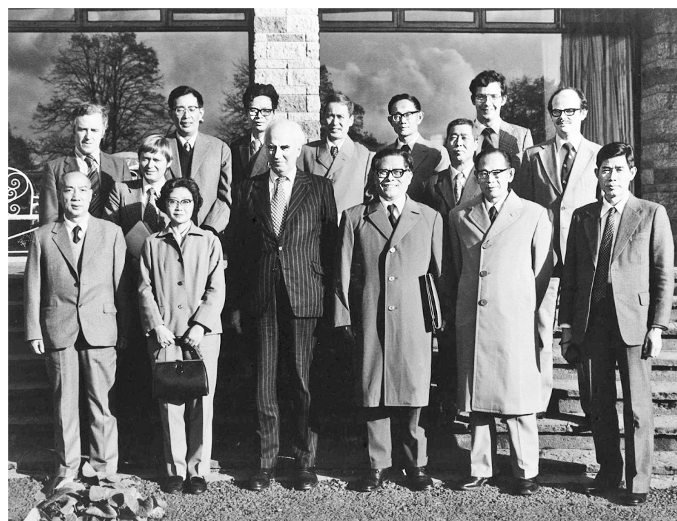
上图:1980年10月底,江泽民同志(前排右三)在爱尔兰香农开发区考察时同开发区负责人等合影。