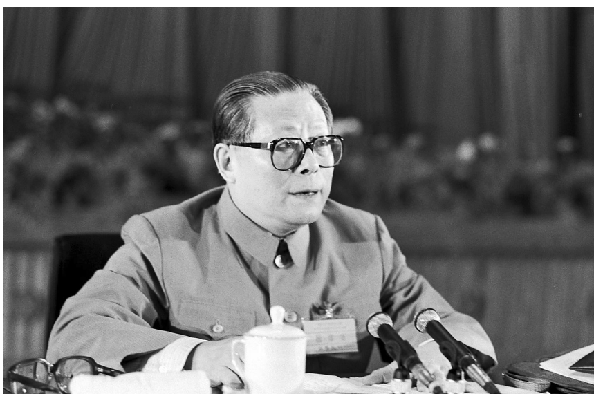
上图:1989年6月23日至24日,中国共产党第十三届中央委员会第四次全体会议在北京召开。这是江泽民同志在会上讲话。