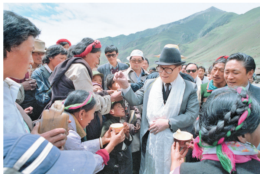
上图:1990年7月25日,江泽民同志与藏族群众共庆望果节。