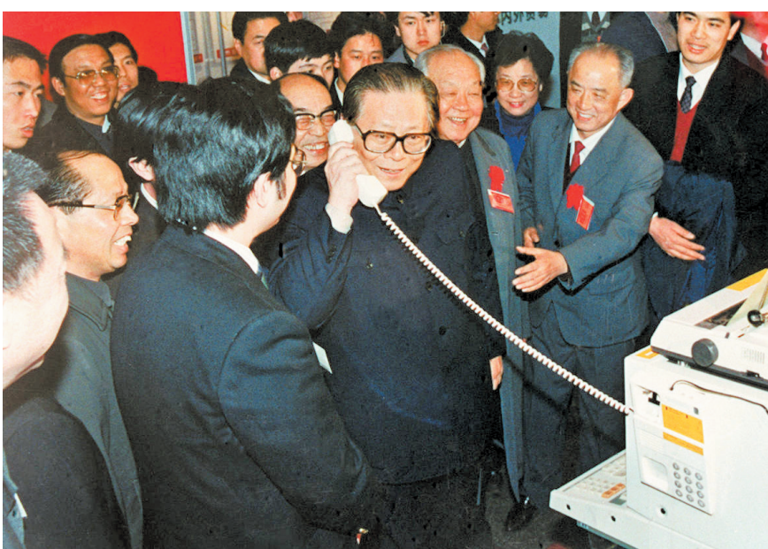
上图:1984年5月,江泽民同志在北京展览馆举行的全国电子新产品展览会上,试用国际长途电话向远方的工作人员问候。