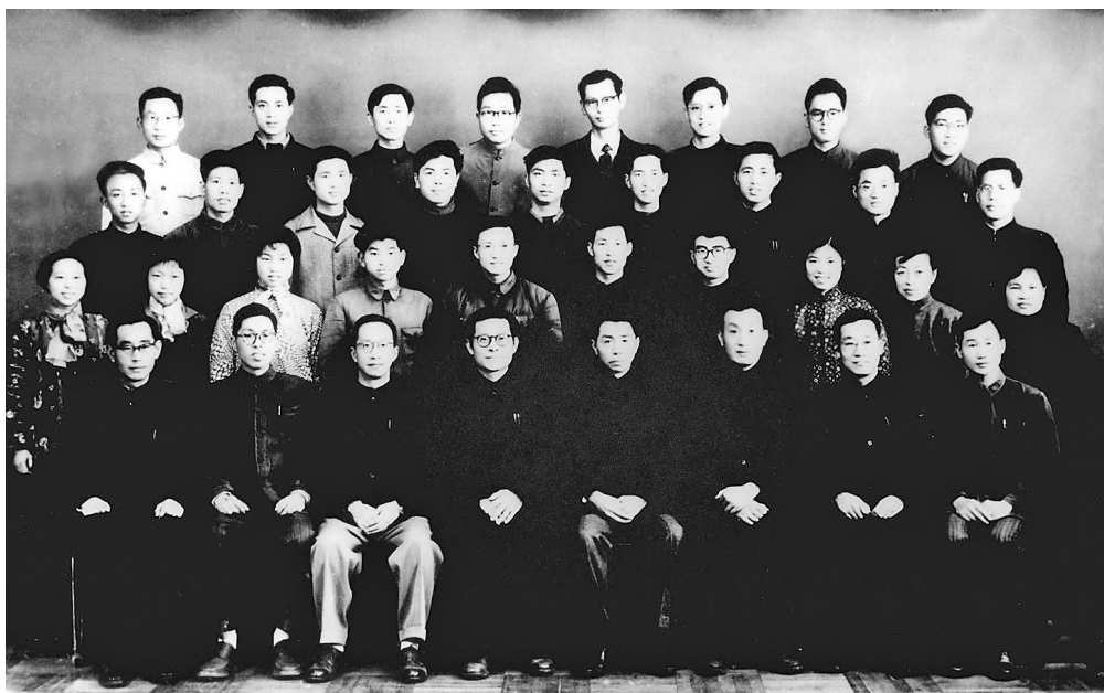
上图:1963年3月,江泽民同志(前排右五)在上海同小型三相异步电机全国统一系列设计领导小组成员合影。