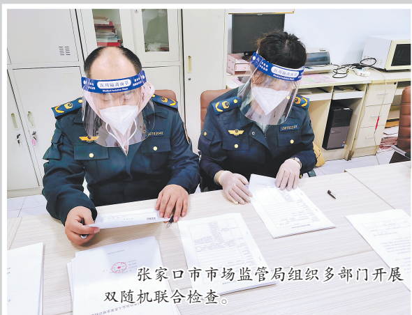
张家口市市场监管局组织多部门开展双随机联合检查。