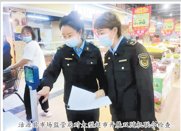
涪源县市场监管局对大型超市开展双随机联合检查。