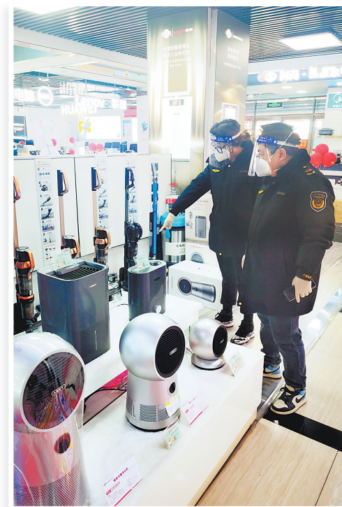
张家口市市场监管局组织开展大型商超多部门双随机联合检查。

张家口市通过采取一系列优化措施,有效促进了各部门履职尽责能力,减轻市场主体日益增长后的监管压力,实现监管效能的最大化。随机抽查使所有市场主体时时保有对法律敬畏感,“市场秩序第一责任人”的作用得到充分发挥,履行法律责任和义务得到显著增强,事中风险防范和警示的作用得到全方位检验。“双随机、一公开”监管在张家口市得到全面优化,持续助力高质量发展。“市场监管部门作为高质量发展的重要推