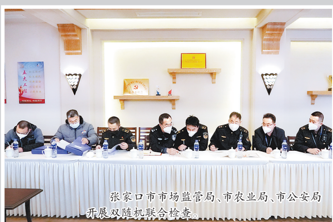
张家口市市场监管局、市农业局、市公安局开展双随机联合检查。