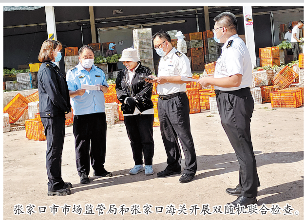
张家口市市场监管局和张家口海关开展双随机联合检查。