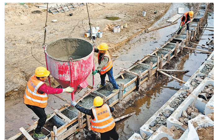
近日,在滦州市别河综合治理工程现场,工人们正加紧施工。别河综合治理工程是市为民办实事的民心工程之一,工程完工后,别河防洪、行洪能力将得到有效提升。

据了解,全域取水口在线计量监控全部覆盖,有助于精准掌握全域用水量使用情况,精准管控地下水,统筹生产、生活、生态用水,完善水资源配置格局,提高水资源利用效率,增强水资源安全保障能力。唐山市将在丰南经验的基础上,在丰南区推广农业灌溉取水口在线计量监控全覆盖,启动乐亭县、玉田县部分乡镇农业灌溉取水口在线计量监控全覆盖,以点带面、有序推进,加快实现唐山市16万眼农业灌溉井精准计量全覆盖。