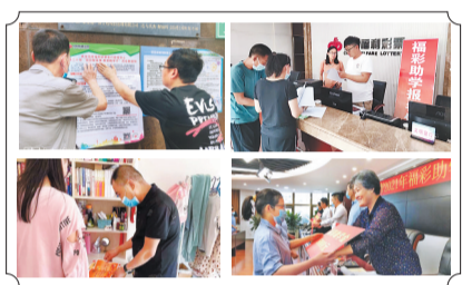
▲全省福彩系统“福彩献真情 爱心助学”活动剪影。