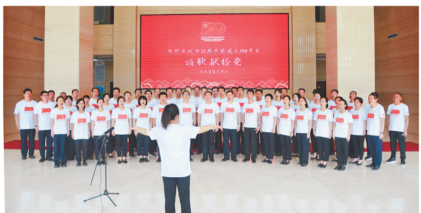
2021年6月30日,省福彩中心隆重举行“热烈庆祝中国共产党成立100周年——颂歌献给党”红歌大合唱活动。

2021年,河北省福彩中心扎实推进党史学习教育,精心组织系列活动庆祝建党100周年,开展了“学党史、颂党恩、展风采、立新功”主题演讲、“学党史、进基层、庆百年”主题党日、“庆祝建党百年唱红歌”等活动,不断从党的百年历史中汲取智慧和力量;扎实开展“我为群众办实事”实践活动,为困难群众送去温暖和关爱。