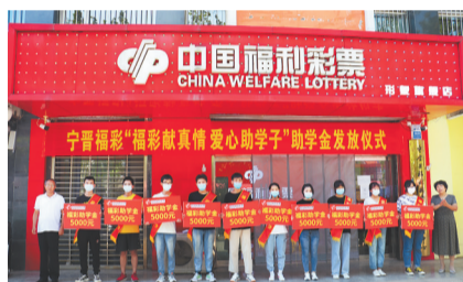
▲宁晋福彩“福彩献真情 爱心助学”助学金发放仪式现场。

河北“福彩献真情 爱心助学”活动是经省民政厅批准,由河北省福彩中心自主发起的一项公益项目。2021年,河北福彩开展了第20届“福彩献真情 爱心助学”活动,全省福彩系统共投入1377.8万元,资助了2618名困难家庭学生。