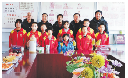
▲承德福彩关爱留守儿童。

2021年,河北福彩始终秉承公益理念,积极服务民生、回报社会,开展爱心济困、社区服务、志愿服务等活动,践行公益责任,为构建和谐社会贡献力量。