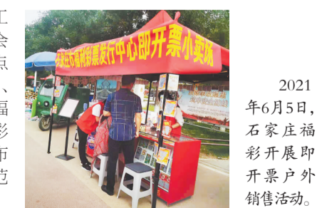
2021年6月5日,石家庄福彩开展即开票户外销售活动。

河北福彩不断完善渠道合规管理工作,夯实福利彩票市场基础。全年向社会公开征召销售网点262个,拓展兼营网点382个;各地福彩中心还在商场、旅游点、集市等地开展户外销售活动373场。省福彩中心还统一出资,在各地建成10个福彩示范形象店,并为销售网点制作号码分布图,以点带面,不断提升全省销售网点规范化建设水平。