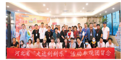
▲2021年,河北福彩组织开展了两批次“走近刮刮乐”活动。