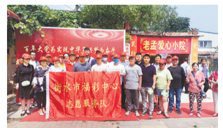
▲衡水福彩走进老孟爱心小院。