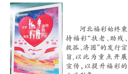
▲河北福彩始终秉持“扶老、助残、救孤、济困”的发行宗旨,以此为重点开展宣传,以提升福彩的公益形象。