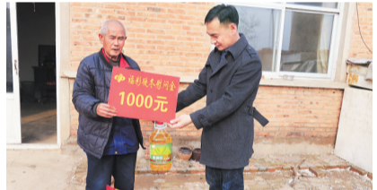
▲承德福彩关爱留守儿童。

2021年,河北福彩中心继续开展“福彩暖冬”公益活动,投入200万元公益金,对2000名农村分散供养特困人员进行资助。自2009年至2021年,“福彩暖冬”活动已开展10届,共投入福彩公益金2900多万元,让2.8万多户困难群众受益。