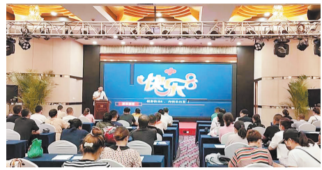
▲2021年3月,邯郸、承德、定州等地福彩中心分别开展了快乐8游戏推广培训,提升服务能力。

河北福彩不断通过培训强化销售人员的服务意识,增强其业务能力;不断建立健全客户服务工作机制,畅通各种沟通渠道;积极助力社工服务,为公众提供专业化社会服务。特别针对疫情带来的不便,报经中福彩中心同意,出台有关暂缓计算兑奖期的政策,充分保障中奖者合法权益。