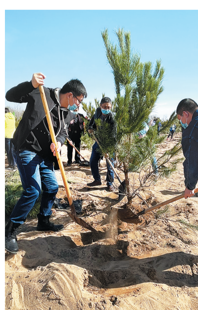
▲2021年5月14日,石家庄市福彩中心组织党员干部到社区进行义务劳动。

河北福彩坚持绿色发展理念,积极践行绿色办公,及时粉碎销毁尾票,回收利用废票组织开展即开票手工艺品大赛,投入资金用于节水节电、绿色出行等,增强从业人员保护生态、节俭节能、低碳生活的意识和能力,为生态环境建设贡献力量。