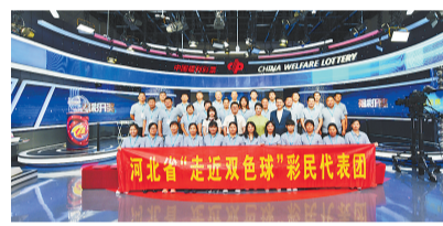
▲2021年,河北福彩先后开展了五批次“走近双色球”活动,组织公众亲临北京双色球开奖现场。

河北福彩持续推进彩票公信力建设,不断拓宽信息发布渠道,通过官网、官微、实体店及合作媒体等渠道,及时发布了部门预算、年度销售情况等福彩重要信息;逐步建立接受公众、媒体、政府等监督的机制,接受各方监督;坚持公开透明,继续组织“走近双色球”“走近刮刮乐”活动,组织社会公众亲临开奖和印制现场,增强与公众互动。