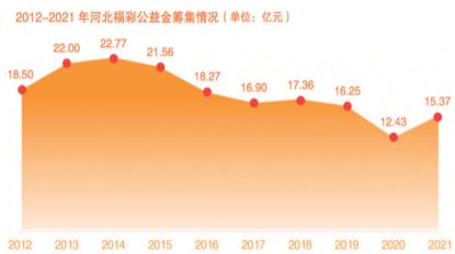
►2012—2021年河北福彩公益金筹集情况

河北福彩始终秉承“扶老、助残、救孤、济困”的发行宗旨,致力于社会福利和公益事业。截至2021年底,累计筹集福利彩票公益金280多亿元,为社会福利和社会公益事业发展作出了重大贡献。