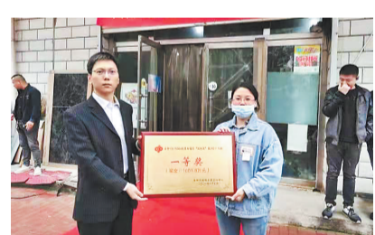
▲河北省文明办发布2021年11月销售员送温暖”活动,投入5万元,为全市销售员发放冬季保暖用品。