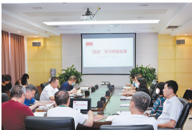
2021年6月24日,河北省福彩中心党总支召开宣讲“四史”学习专题党课。

河北福彩始终把党建工作摆在首位,坚持把党史学习教育和“四史”宣传教育作为重要政治任务,认真落实民主生活会等组织生活制度,深入开展“三基”建设年活动,以党建带动队伍能力建设。