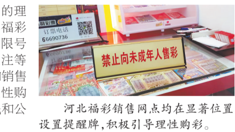
河北福彩销售网点均在显著位置设置提醒牌,积极引导理性购彩。

河北福彩始终秉承责任优先的理念,积极引导理性购彩,不断完善福彩3D等游戏的风险控制机制,坚持限额限购销售,控制包号倍投、大额投注等非理性购彩行为;并在官方微信和销售网点等线上线下场所,设置了“理性购彩、量力而行”的温馨提醒,对彩民和公众进行正确引导。