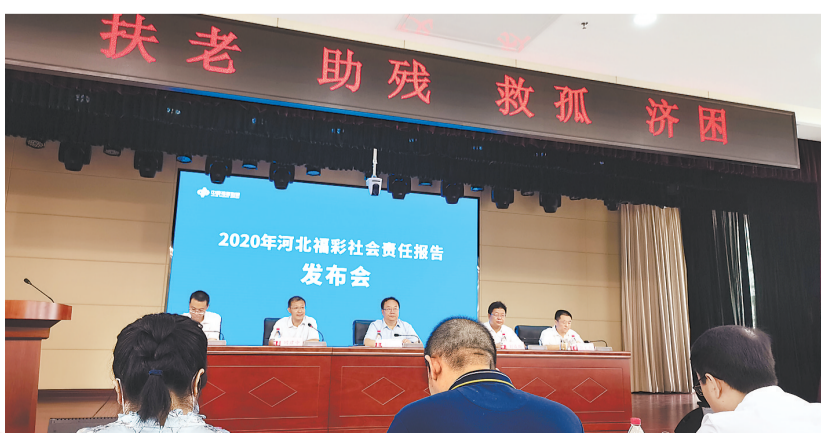
2021年7月27日上午,省福彩中心召开2020年福利彩票社会责任报告发布会。

河北福彩将责任理念和要求贯穿到福利彩票运行的全过程,根据《中国福利彩票责任彩票手册》等指导,制定了责任彩票工作框架,对责任彩票工作进行全面梳理和分解,逐步建立了统筹督导、分步落实的社会责任组织体系。