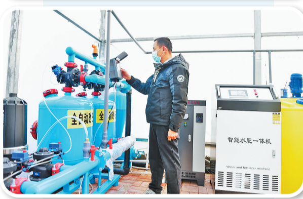
上图:在宁晋县晶澳太阳能有限公司生产车间,工人通过控制面板操控仪器。 中图:河北冀中新材料有限公司烘干车间,智能搬运机器人在运送碳纤维产品。 下图:日前,在平乡县柴口股份经济合作社种植基地的温室大棚,村民在调试智能水肥一体机。