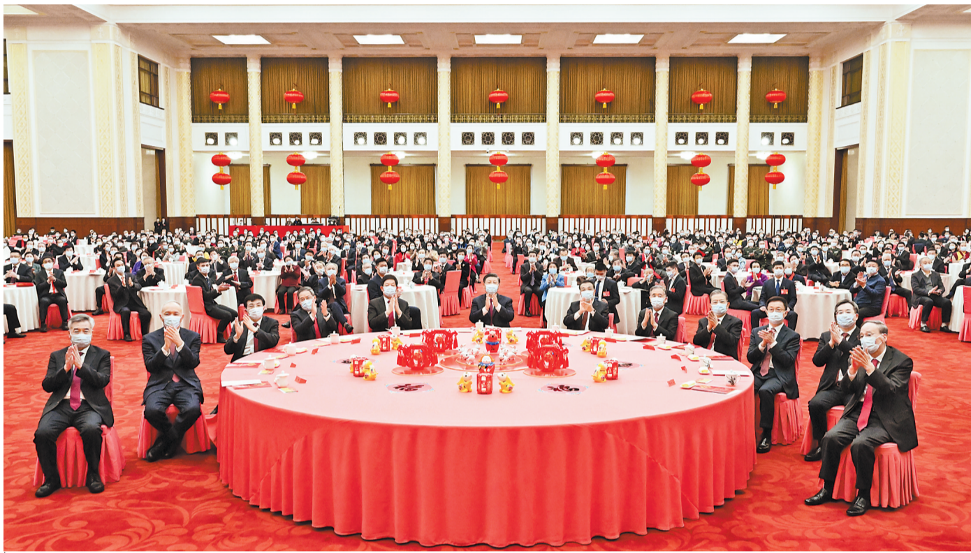
1月20日，中共中央、国务院在北京人民大会堂举行2023年春节团拜会。党和国家领导人习近平、李克强、栗战书、汪洋、李强、赵乐际、王沪宁、韩正、蔡奇、丁薛祥、李希、王岐山等同首都各界人士齐聚一堂，共迎新春。

新华社北京1月20日电 中共中央、国务院20日上午在人民大会堂举行2023年春节团拜会。中共中央总书记、国家主席、中央军委主席习近平发表讲话，代表党中央和国务院，向全国各族人民，向香港特别行政区同胞、澳门特别行政区同胞、台湾同胞和海外侨胞拜年。