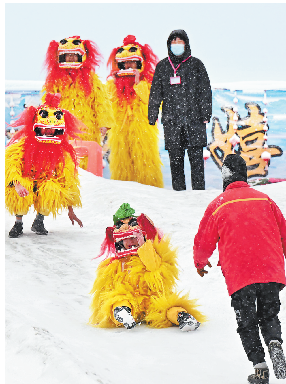
1月23日,一场狮舞表演结束后,“小狮子”们在雪中嬉戏。