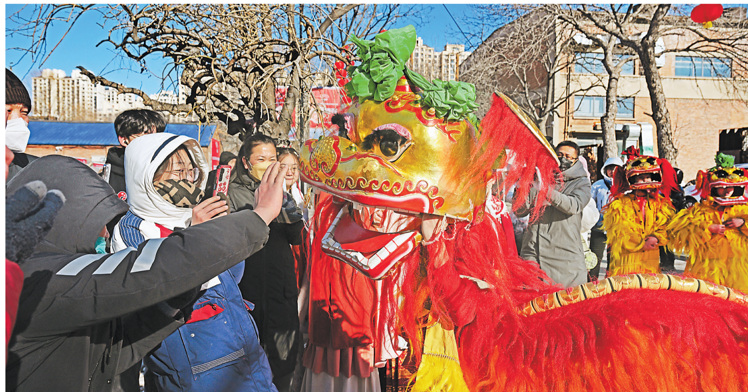
1月24日,沧县刘吉舞狮团队员们在演出现场与观众互动。