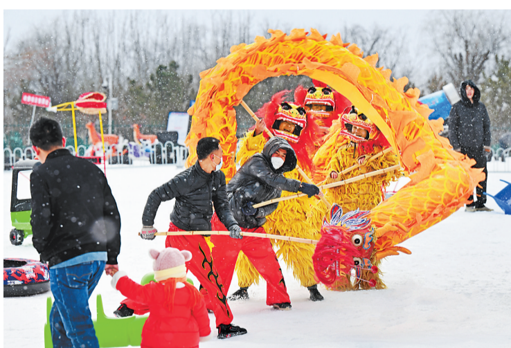
演出开始前,身穿狮衣的队员们舞起长龙,俏皮的“混搭”表演引得路人驻足观看。