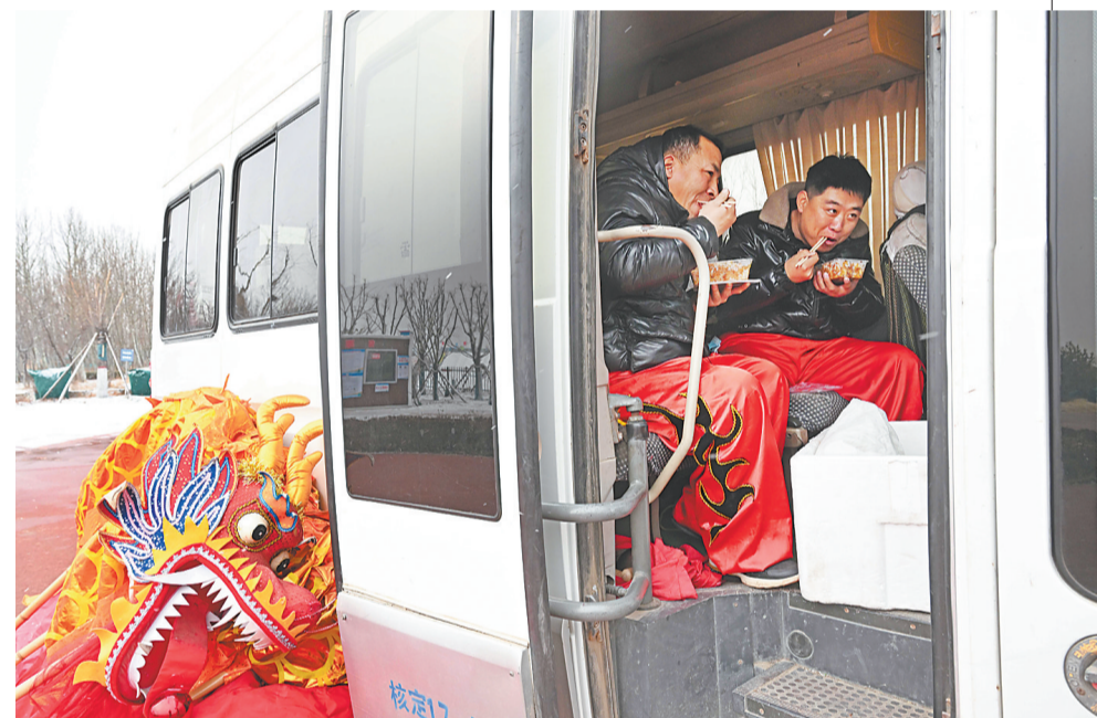
每年正月都是舞狮团最忙碌的时候,队员们在车内简单吃口午饭后就又要奔赴下一场演出地点。