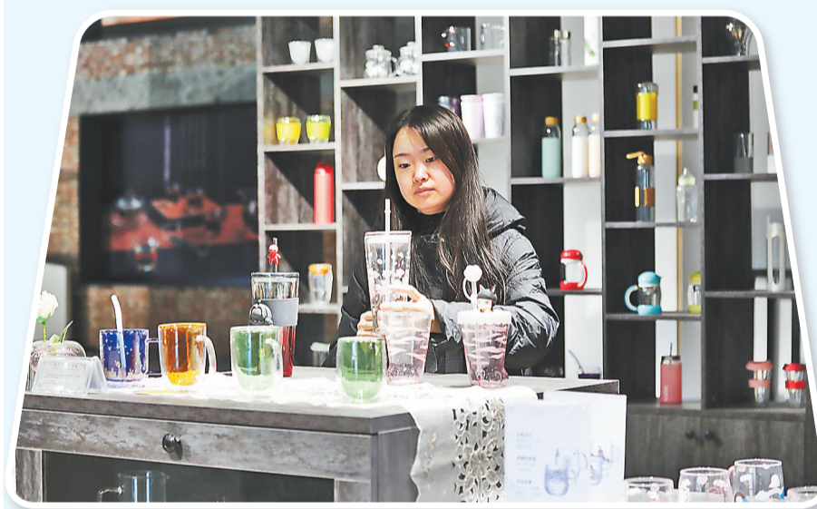
上图:在沧州渤海新区黄骅市天天食品发展有限公司,工人在脆冬枣加工车间内忙碌。