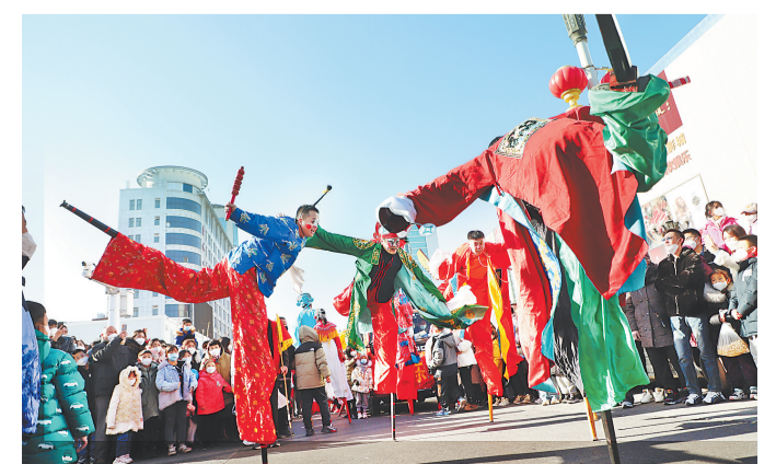
1月28日,沧州市民俗高跷队演员正在表演高跷。精彩的民俗表演,吸引了众多群众围观欣赏。

在本次活动中,与会人员观看了孟村宣传片《活力之城 幸福孟村》。孟村回族自治县开发区与山东龙三辉建设工程有限公司等企业进行了招商合作签约,共签约5个项目,总投资18.7亿元。