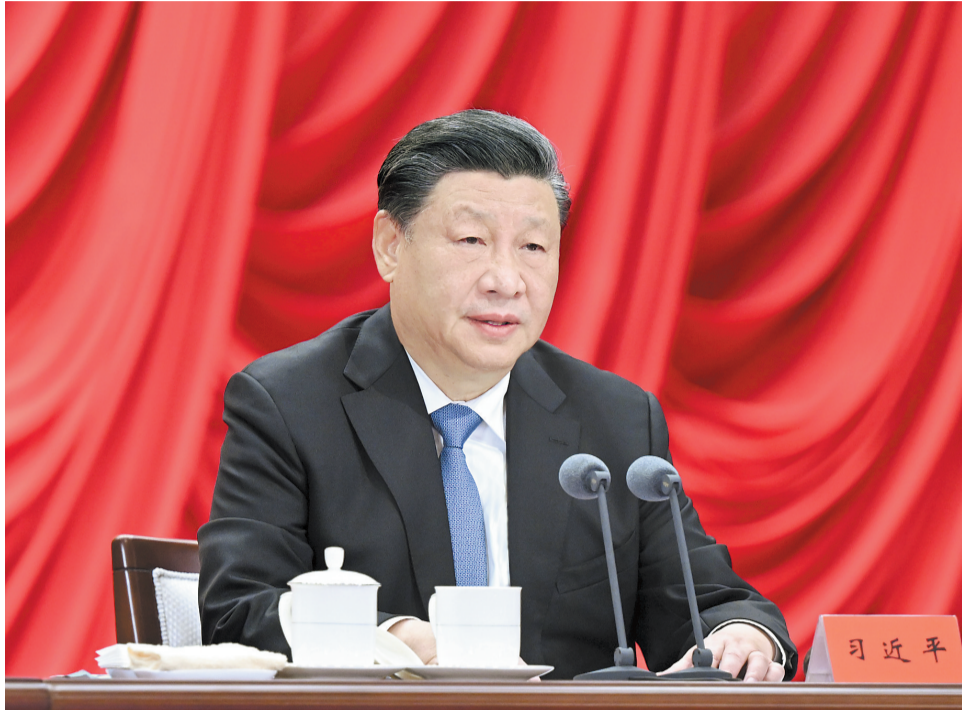
3月1日，中共中央党校建校90周年庆祝大会暨2023年春季学期开学典礼在北京举行。中共中央总书记、国家主席、中央军委主席习近平出席并发表重要讲话。

新华社北京3月1日电 中共中央党校3月1日举行建校90周年庆祝大会暨2023年春季学期开学典礼。中共中央总书记、国家主席、中央军委主席习近平出席并发表重要讲话。他强调，党校始终不变的初心就是为党育才、为党献策。各级党校要坚守这个初心，锐意进取、奋发有为，为全面建设社会主义现代化国家、全面推进中华民族伟大复兴作出新的贡献。