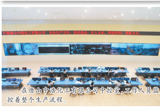
在唐山中润化工有限公司中控室,工作人员监控着整个生产流程。

有效落地,推动资本向基础产业和关键领域聚焦,逐步建成主业精强、业绩突出、结构合理的高质量发展现代化能源化工集团。