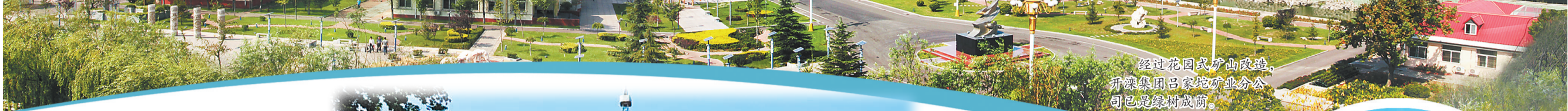
经过花园式矿山改造，开滦集团吕家窑矿业分公司已建绿树成荫。

2022年,面对重重挑战,开滦集团坚持以高质量发展为主题,全面推进改革创新和转型升级,保持稳健向好发展态势。