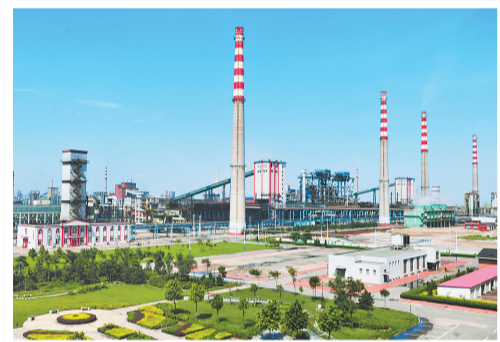
唐山中润煤化工有限公司厂区。在这里,煤炭被转化成几十种或固态或液态或气态的新产品。

良好的经济运行离不开卓有成效的管控。开滦集团构建了包含4大类40项具体指标的高质量发展指标体系,做实做细差异化分类考核政策体系,有针对性地实施绩效考核、产量上限考核、内部锁价购销等一系列政策机制,逐月加强经济运行分析调度,根据不同阶段特点,先后实施“双过半”“争创业绩最好年”等多个专项攻坚,实现了经济高起点开局、高标准推进、高质量运行。