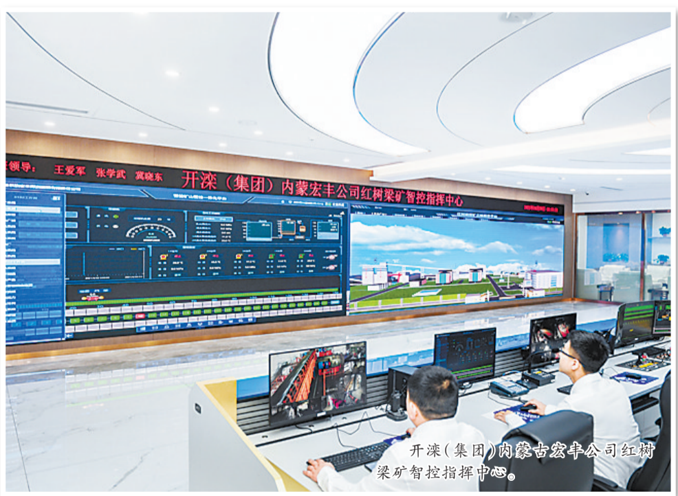
开滦(集团)内蒙宏丰公司红塔梁矿智控指挥中心。

苏科舜:我们要用好看家本领,认真落实国家能源战略和煤炭产业政策,把“安全高效开采煤炭、清洁高效利用煤炭”作为未来行业发展的主要竞争力,持续加大力度推动煤炭产业