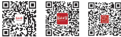
河北日报客户端、微博、微信