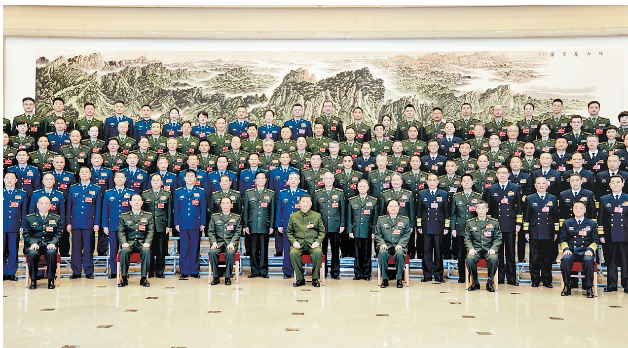
3月8日下午,中共中央总书记、国家主席、中央军委主席习近平出席十四届全国人大一次会议解放军和武警部队代表团全体会议。这是会议开始前,习近平亲切接见代表团全体代表,并同大家合影留念。