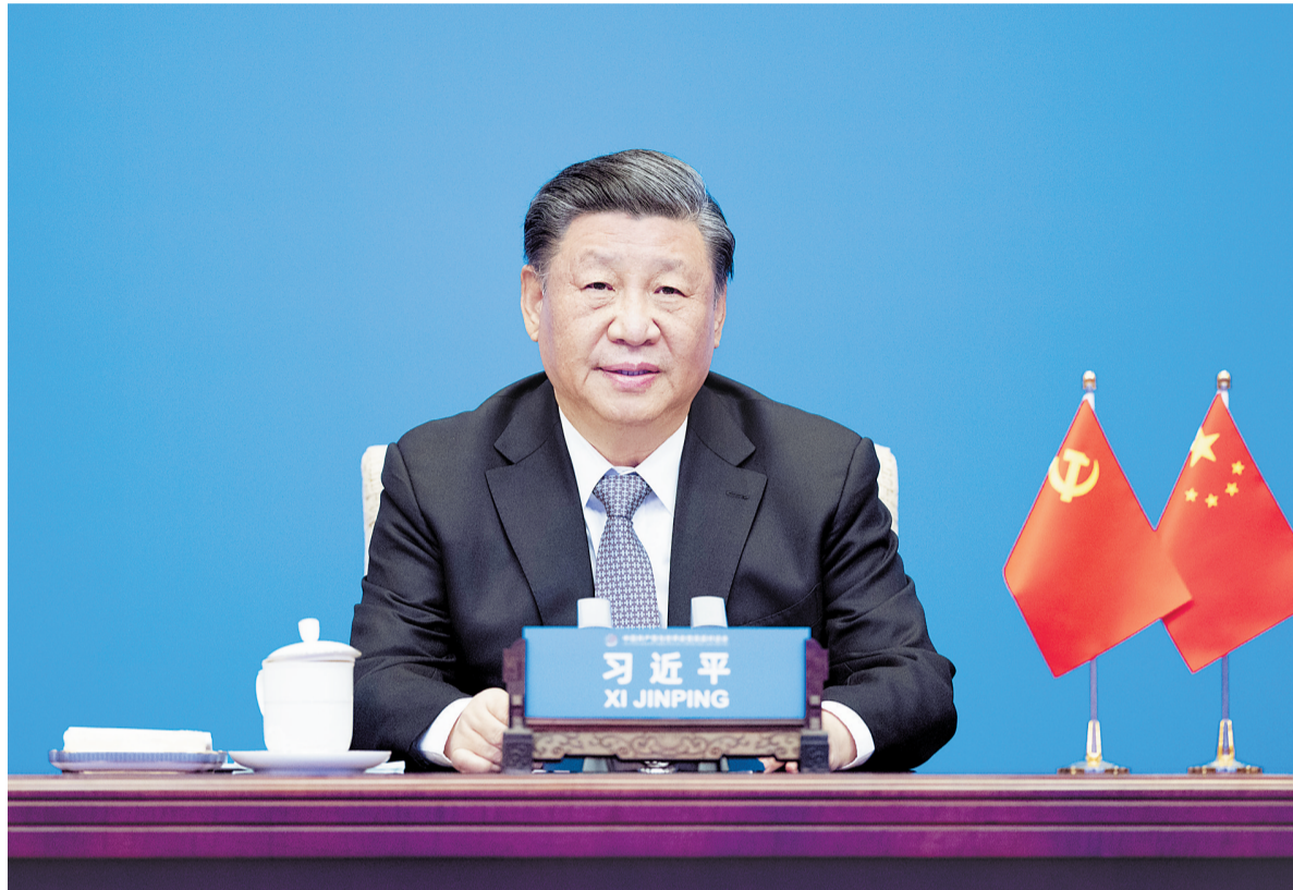
3月15日，中共中央总书记、国家主席习近平在北京出席中国共产党与世界政党高层对话会，并发表题为《携手同行现代化之路》的主旨讲话。