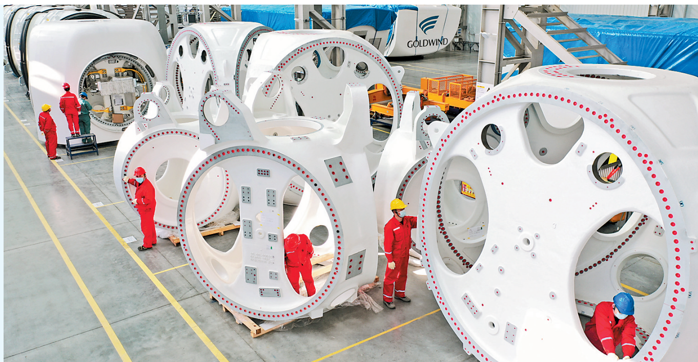
3月19日,工人在风电车间装配机舱(无人照照片)。近年来,隆化县在优化产业结构过程中,立足区位优势,大力发展风电装备制造产业,通过引进风电装备制造龙头企业和配套企业,加大科技创新力度,不断延伸上下游产业链,打造风电装备制造产业集群,助推区域经济高质量发展。