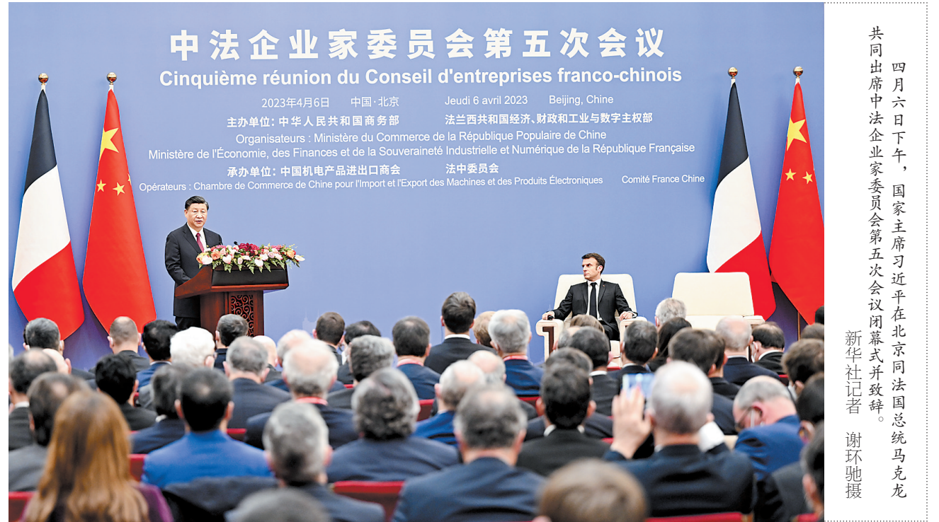
四月六日下午，国家主席习近平在北京同法国总统马克龙共同出席中法企业家委员会第五次会议闭幕式并致辞。