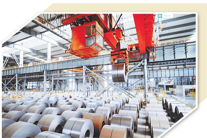
河北联通在河钢唐钢落地“5G+无人天车”。