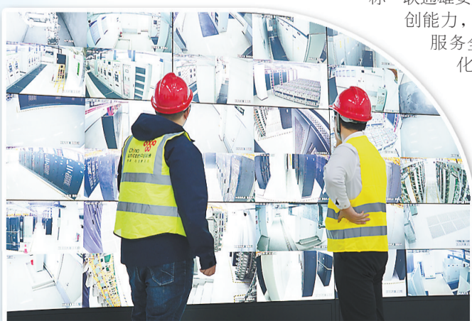
河北联通工作人员在雄安智能城市光网大屏前进行技术测评。