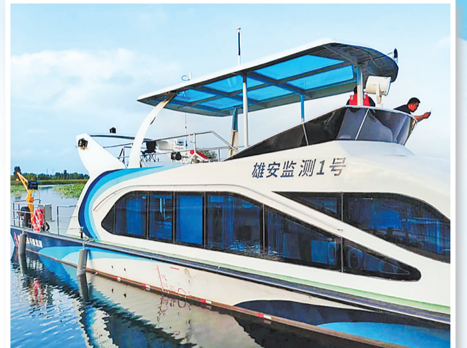
搭载河北联通一体化监测体系的水质监测船正在白洋淀上作业。