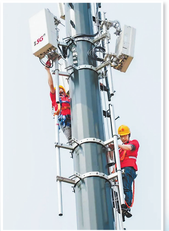
河北联通在建设5G基站。

一方面,自立自强提升“硬实力”,手握22项资质、17项专利、95项软著,自主研发的Unilink工业互联网平台荣获2022中国国际数字经济博览会“创新成果奖”一等奖。另一方面,开放胸襟打好“团体赛”,与100余家主流厂商、6所省内重点高校及科研院所深入合作,成立联合实验室20个,聚焦2项核心技术、1项国家课题项目,4项重要科技项目持续攻坚……作为河北联通的创新产品中心、支撑中心、能力中心,联通雄安产互公司加速打造自主核心能力,有力发挥了数字技术对实体经济发展的放大、叠加、倍增作用。