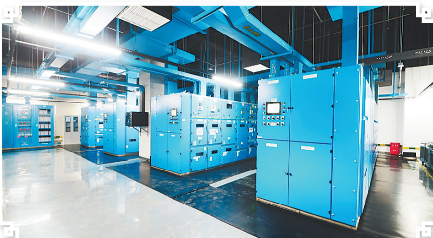
中国联通(怀来)大数据创新产业园。

全速推进千兆网络规模化建设,让“大联接”速度更快、品质更高。目前,河北联通10G PON(万兆)端口占比已达