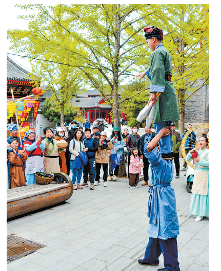
4月29日，游客在秦皇岛市山海关区古城观看表演。

此外，武安七步沟景区将举办牡丹盛会，邯郸方特国色春秋主题乐园将开展主题表演，永年广府古城《武韵留香》《太极至爱》《开衙仪式》等节目将精彩上演……邯郸通过“线下+线上”形式发放文化和旅游惠民卡(券)3万余张，各大景区备好节日文旅大餐，带动当地旅游市场持续升温。