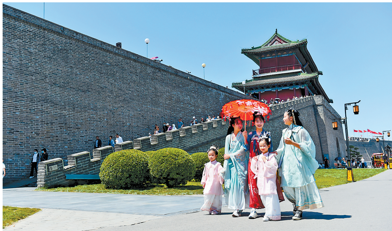
4月30日，身着汉服的北京游客在正定县南城门景区游玩。“五一”假期，许多游客来到正定古城赏美景、品美食、看表演，享受假日欢乐时光。