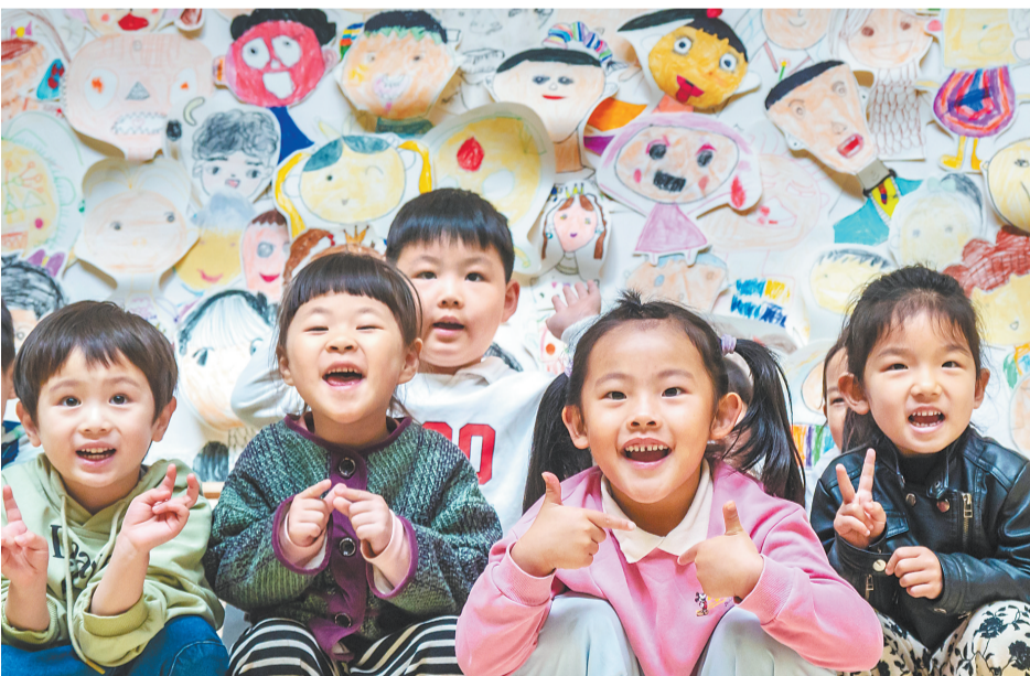
◀ 4月28日,雄安容和悦泽幼儿园的小朋友们在快乐游戏。雄安新区配建了高标准的学前教育设施。