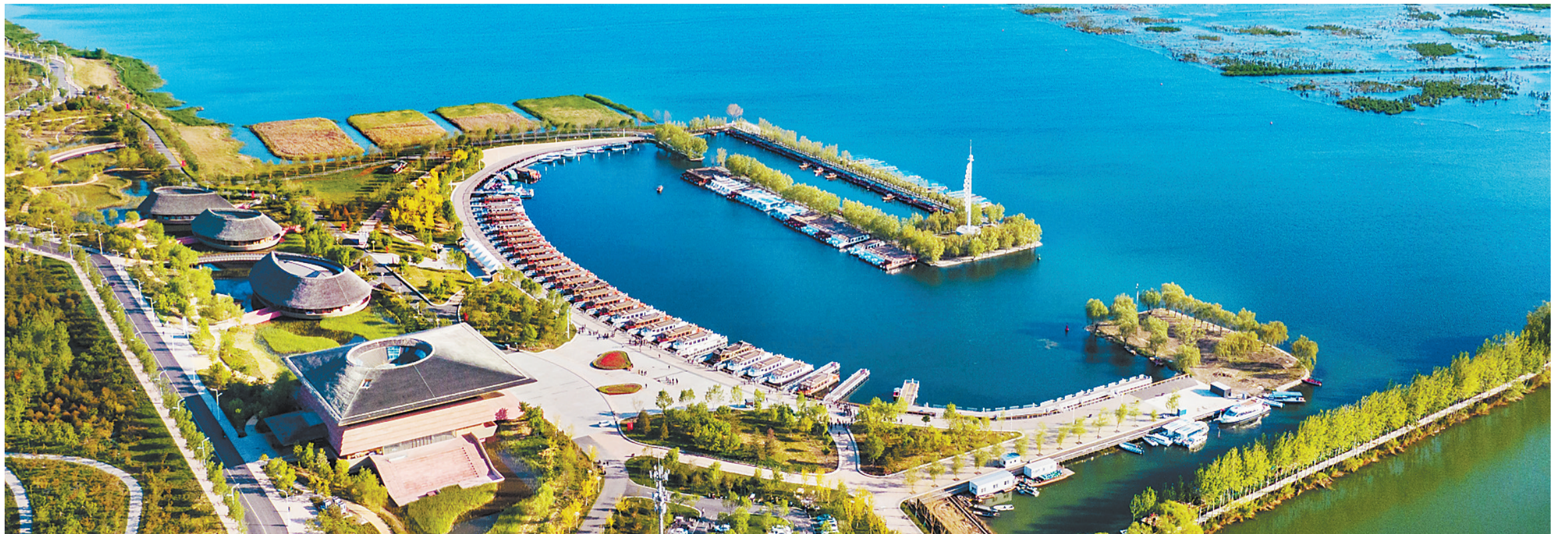
4月28日拍摄的雄安新区白洋淀。