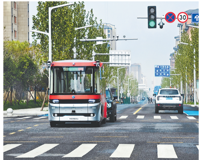
4月28日,智能网联巴士901线测试车在雄安新区容东片区道路上行驶。

融,人与自然和谐相处的优美画卷徐徐铺展,白洋淀水质从劣V类提升至Ⅲ类标准,野生鸟类已达252种,较新区设立前增加46种,白洋淀“华北之肾”功能初步恢复。47万多亩“千年秀林”有序铺展,280多种、2300多万棵苗木在新区大地上茁壮成长,森林覆盖率提高到34%。 创新的味道,来自建设智能便捷的智慧之城。从规划之新,到城市功能不断完善,一批妙不可言的场景开始融入百姓生活,产城融合、职住平衡、生态宜居、交通便捷的宜居新城区初步呈现。未来的雄安新区生活十分便捷、时尚,令年轻人向往,是一座充满青春活力的城市。 “让雄安新区的空气中飘扬着创新的味道”,诗一样的表达,承载着人们的希望,也给人们带来无尽的想象。我们相信,创新动能澎湃的未来之城,将昂首行进在中国式现代化的康庄大道上。 文/河北日报记者 郭东