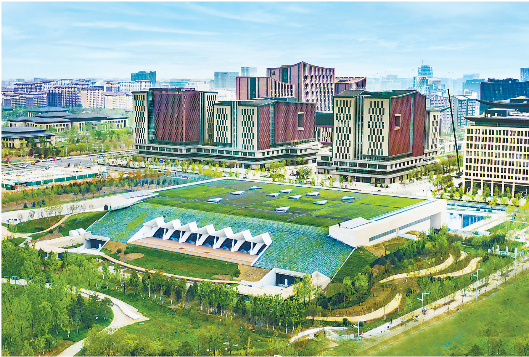
4月27日拍摄的雄安城市计算中心。该中心为智慧城市提供信息化基础资源和大数据服务支撑。