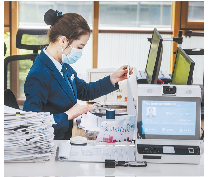
4月27日,雄安新区政务服务中心工作人员在岗位上忙碌。