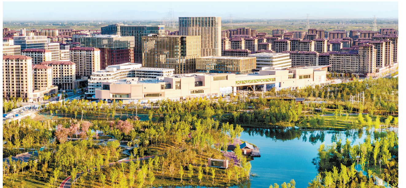
▶ 4月29日拍摄的雄安新区容东片区。