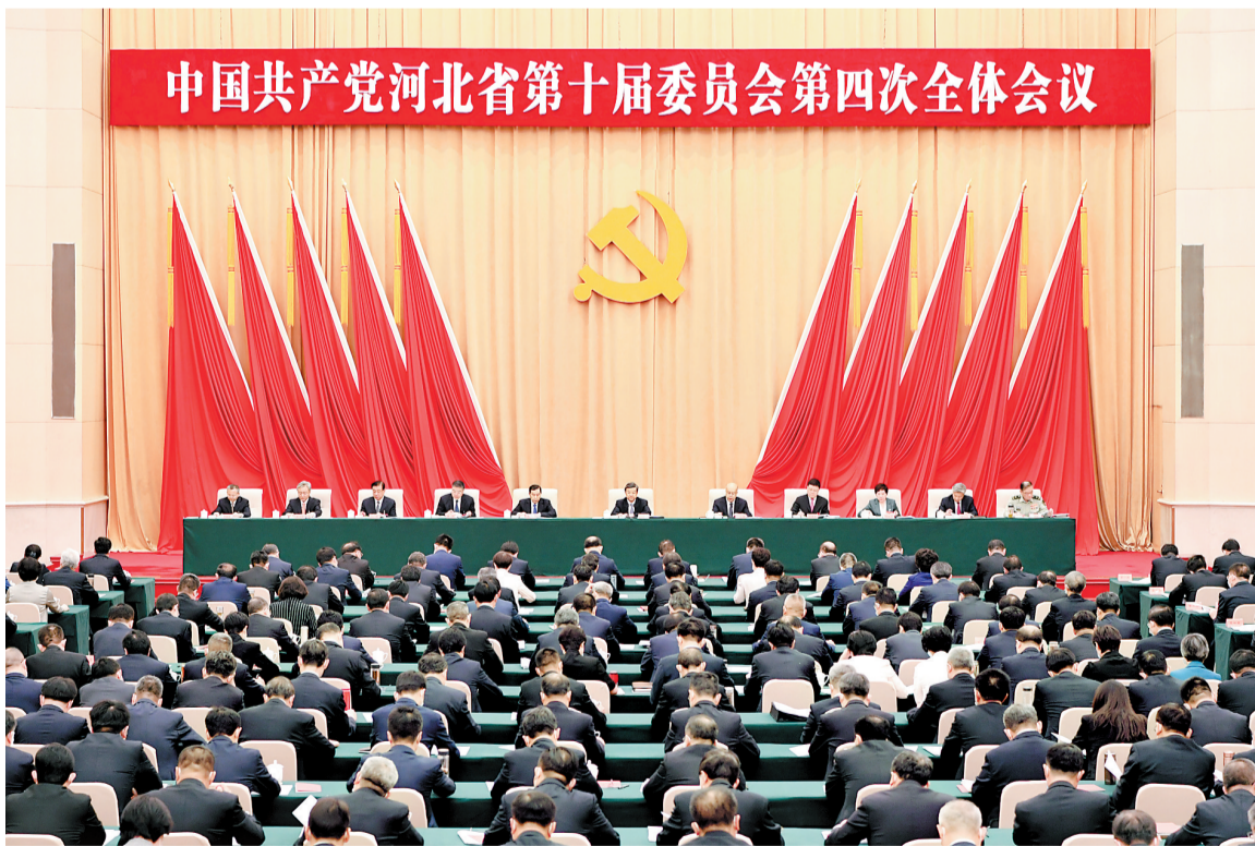
五月二十三日二十四日，中国共产党河北省第十届委员会第四次全体会议在石家庄召开。这是会议现场。

河北日报讯 (记者四建磊、吴轲、尹翠莉) 5月23日至24日，中国共产党河北省第十届委员会第四次全体会议在石家庄召开。全会坚持以习近平新时代中国特色社会主义思想为指导，深入学习贯彻习近平总书记视察河北重要讲话精神，全面贯彻党的二十大精神，完整、准确、全面贯彻新发展理念，牢牢把握高质量发展这个首要任务和构建新发展格局这个战略任务，在推进创新驱动发展闯出新路子，在推进京津冀协同发展和高标准高质量建设雄安新区中彰显新担当，在推进全面绿色转型中实现新突破，在推进深化改革开放中培育新优势，在推进共同富裕中展现新