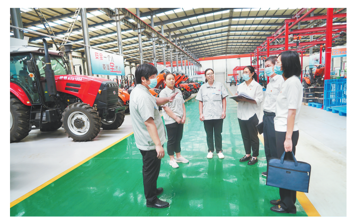
日前,信都区纪委监委成立营商环境工作专班,深入一线,全面查找影响营商环境优化提升的堵点、难点问题。这是工作专班工作人员在信都经济开发区一家农机生产企业走访调研。

目前,任泽区10家劳动者驿站按照总工会建设、城管部门管理、第三方维护的模式运行,深受众多户外劳动者的欢迎。新建的两个劳动者驿站主体已完成,即将投入使用。去年,任泽区政府北街(03)号劳动者驿站、游雅街(06)号劳动者驿站被全国总工会评为“最美工会户外劳动者服务站”,溢阳路(02)号劳动者驿站、昌平路(09)号劳动者驿站被省总工会评为“最美工会户外劳动者服务站”。