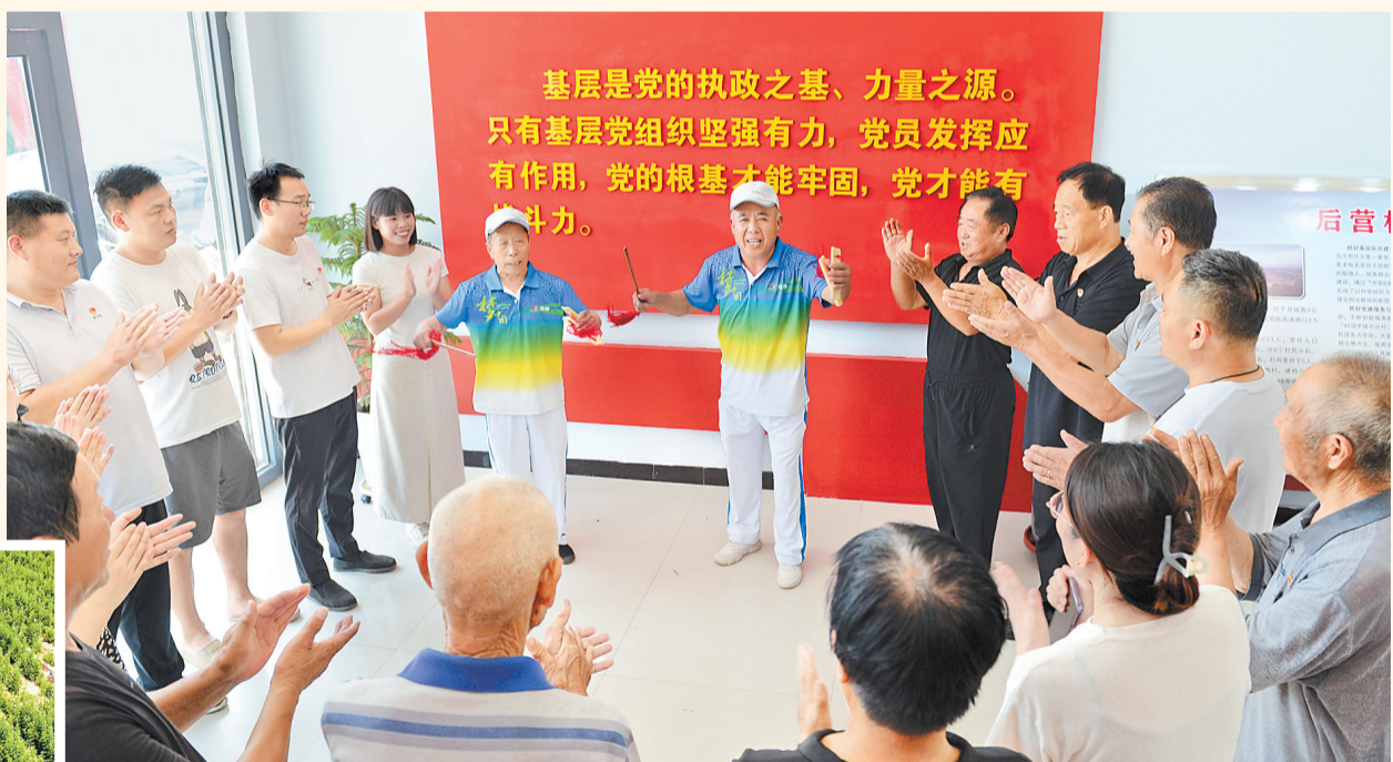
6月27日,平乡县后营村村民活动中心,基层宣讲员在表演快板。连日来,平乡县丰富宣讲形式,组建“五老”宣讲团、退伍老兵宣讲团、“冀青”宣讲团等特色宣讲小分队,以“文艺+理论”的宣讲模式,将党的创新理论融入理论宣讲、文艺表演、书画创作等形式中,推动党的好声音“声”入人心。