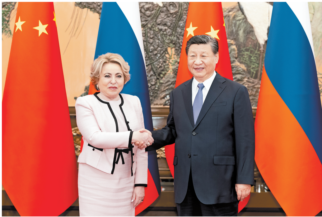
7月10日下午,国家主席习近平在北京人民大会堂会见俄罗斯联邦委员会主席马特维延科。

新华社北京7月10日电(记者郑明达)国家主席习近平7月10日下午在人民大会堂会见俄罗斯联邦委员会主席马特维延科。