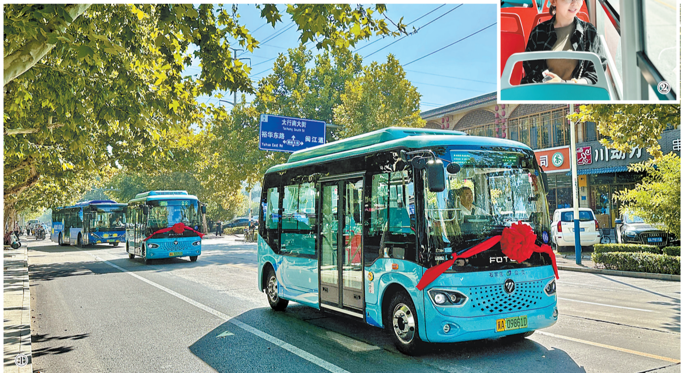
图①9月21日,石家庄首批5.9米巡游公交上路,乘客可手机下单预约公交车出行,实现“车随人动”。河北日报记者 田明摄 图②9月21日,乘客体验巡游公交。河北日报记者 田明摄