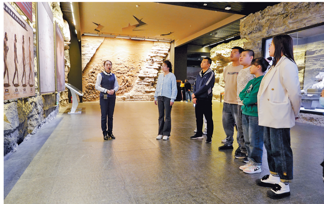
10月7日,游客走进蔚州博物馆,聆听精彩讲解。

这件泥质陶灶,是蔚州博物馆“十大镇馆之宝”之一,系蔚县余家堡村农民春耕时发现,灶面彩绘价值非凡。“木