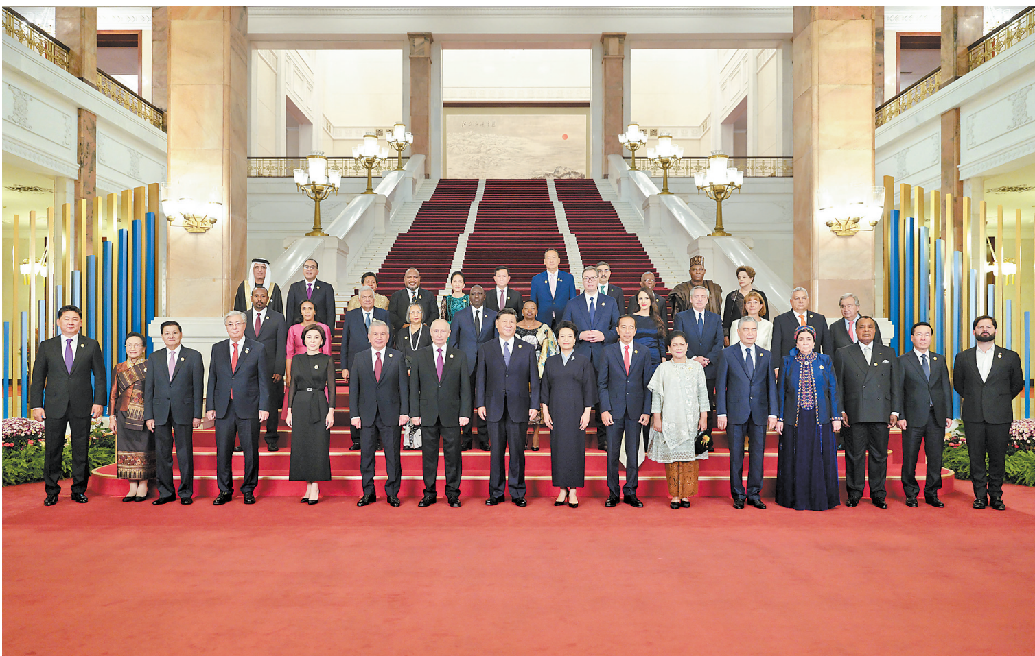
10月17日晚,国家主席习近平和夫人彭丽媛在北京人民大会堂举行宴会,欢迎来华出席第三届“一带一路”国际合作高峰论坛的国际贵宾。这是习近平和彭丽媛同国际贵宾合影留念。

新华社北京10月17日电(记者杨依军、孔祥鑫)10月17日晚,国家主席习近平和夫人彭丽媛在人民大会堂举行宴会,欢迎来华出席第三届“一带一路”国际合作高峰论坛的国际贵宾。李强、赵乐际、王沪宁、蔡奇、丁薛祥、李希、韩正出席。