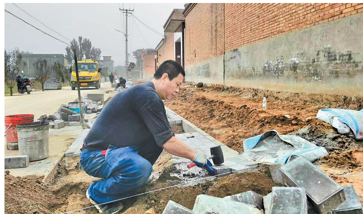
11月3日，孙马庄村街道美化硬化有条不紊地进行着。