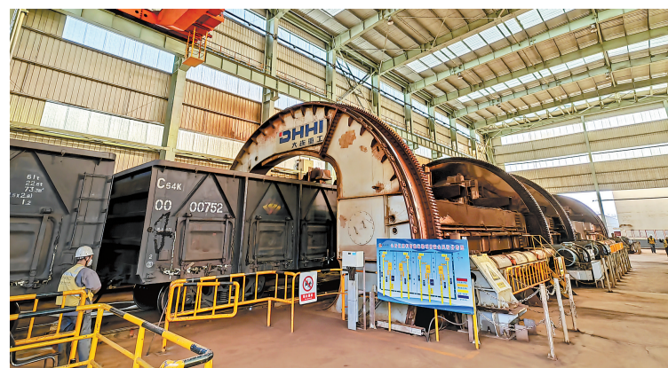
十一月二日,敬业集团卸车机房内,满载铁矿石的火车正在卸车。