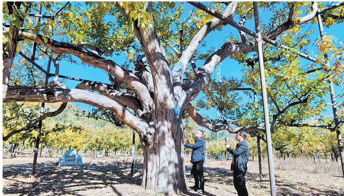
11月3日,游客在宽城满族自治县参观有720年历史的古栗树。