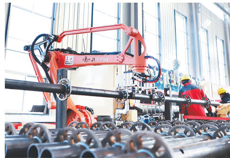
2023年2月13日,在河北鹏鑫管道装备集团有限公司,智能流水线作业现场。