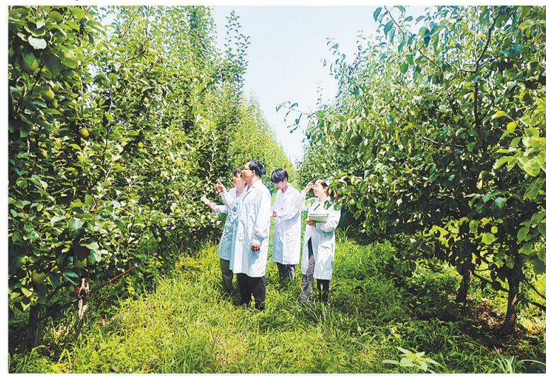
2023年8月8日,在冀梨农民专业合作社内,河北农业大学专家团队进行现场教学。