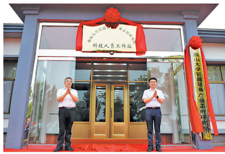
2022年7月25日,燕山大学管道装备制造产业孟村研究院揭牌仪式现场。

深化校企合作是孟村回族自治县深入实施创新驱动、科教兴县、人才强县战略的重要举措。孟村回族自治县加强与相关高校的合作,推动产学研用深度融合,全职引进博士研究生3名、硕士研究生5名、高级工程师2名;柔性引进博士研究生32名、硕士研究生53名。与中国钢铁研究总院、燕山大学、河北农业大学、山西农业大学、浙江工业大学等高等院校深入交流合作,达成合作项目23个。大力推进产业大脑、工业互联网平台等各类产业服务平台建设。深入实施入园升规技改专项行动,谋划建设凤还巢产业园、京津冀产业承接园、云园区高能制造产业园、管道装备产业园。不断建立健全优质企业梯队培育机制,引导企业增加研发投入。建成国家级生产力促进中心、省级管道元件检测中心,形成研发中心、培训中心、检测中心和管道装备物流基地等配套齐全的特色产业集群。全县科技创新能力由C类跃升到B类,获省奖励资金400万元。