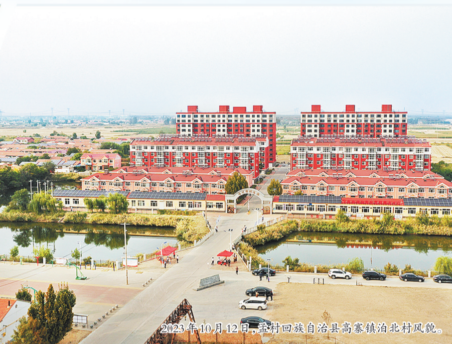
2023年10月12日,孟村回族自治县高寨镇泊北村风貌。