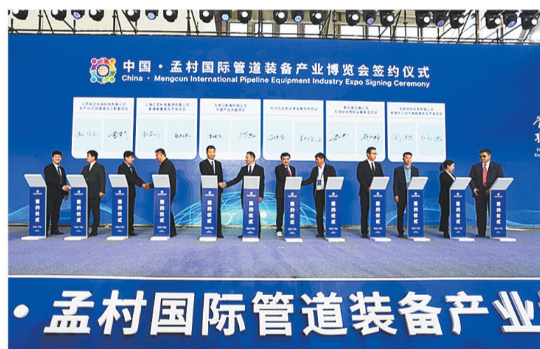
2023年10月26日,中国·孟村国际管道装备制造产业博览会签约现场。