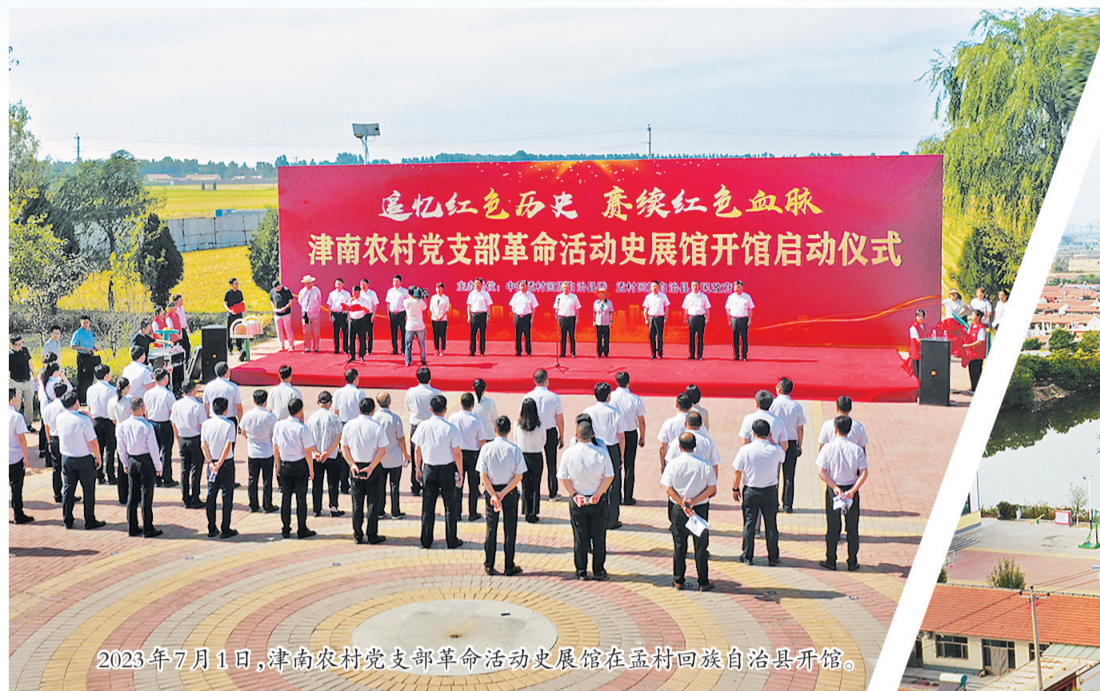
2023年7月1日,津南农村党支部革命活动史展馆在孟村回族自治县开馆。

近年来,孟村回族自治县始终将党建工作摆在关键位置,通过党建引领和示范带动,把党的建设融入经济社会发展全过程。第二批主题教育开展以来,该县坚持把学习推广“四下基层”作为重要抓手,转变干部作风、密切联系群众,着力解决群众急难愁盼问题,切实推动党建优势转化为发展优势、党建成果转化为发展成果,全面推动经济社会高质量发展。