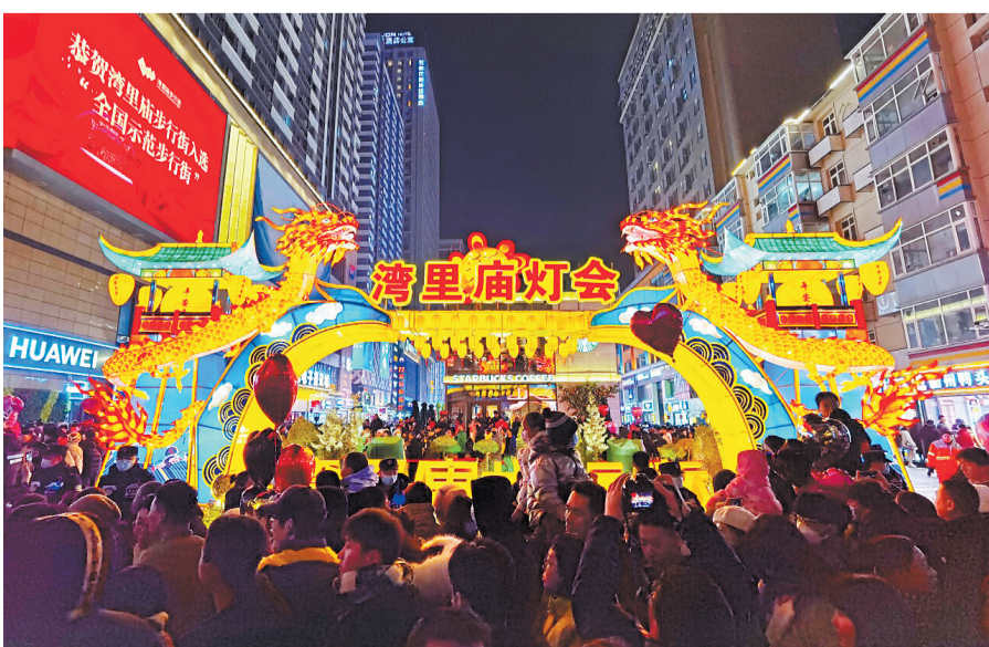
2023年12月31日,石家庄湾里庙步行街跨年活动现场。

据介绍,喜迎2024年元旦佳节,石家庄还在北国商城、火车头步行街、上门关驿道小镇等21个重点商圈、步行街、景点,同步开展了以“活力之城 跨年乐购”为主题的跨年活动,让市民乐享精彩的文化生活,打造点、线、面结合的消费模式,构建“美食+娱乐+购物+旅游”消费新场景。