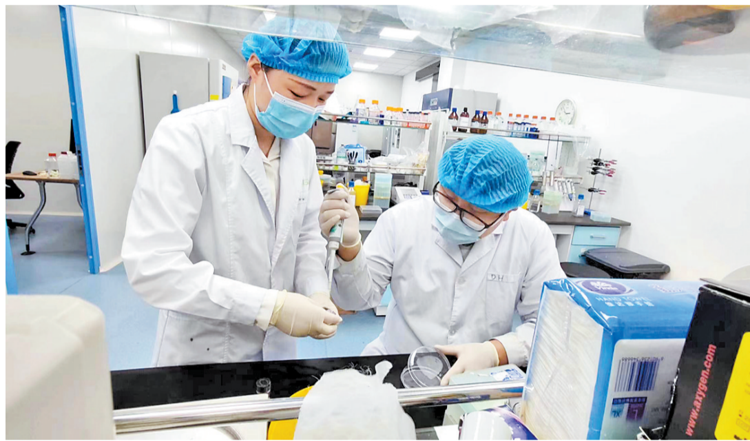
在保定诺未科技有限公司,技术团队正在进行药物研发实验。 本报资料片

为推动协同创新产业协作,我省积极组织京津冀科技成果路演推介对接会、科技成果直通车、中国科学院创新成果进河北等系列活动,2023年,53场活动共促成合作签约232项。