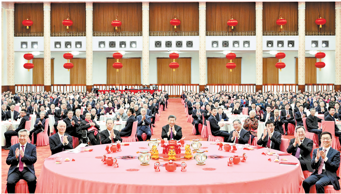
2月8日,中共中央、国务院在北京人民大会堂举行2024年春节团拜会。党和国家领导人习近平、李强、赵乐际、王沪宁、蔡奇、丁薛祥、李希、韩正等同首都各界人士齐聚一堂,共迎新春。

新华社北京2月8日电 中共中央、国务院8日上午在人民大会堂举行2024年春节团拜会。中共中央总书记、国家主席、中央军委主席习近平发表讲话,代表党中央和国务院,向全国各族人民,向香港特别行政区同胞、澳门特别行政区同胞、台湾同胞和海外侨胞拜年。