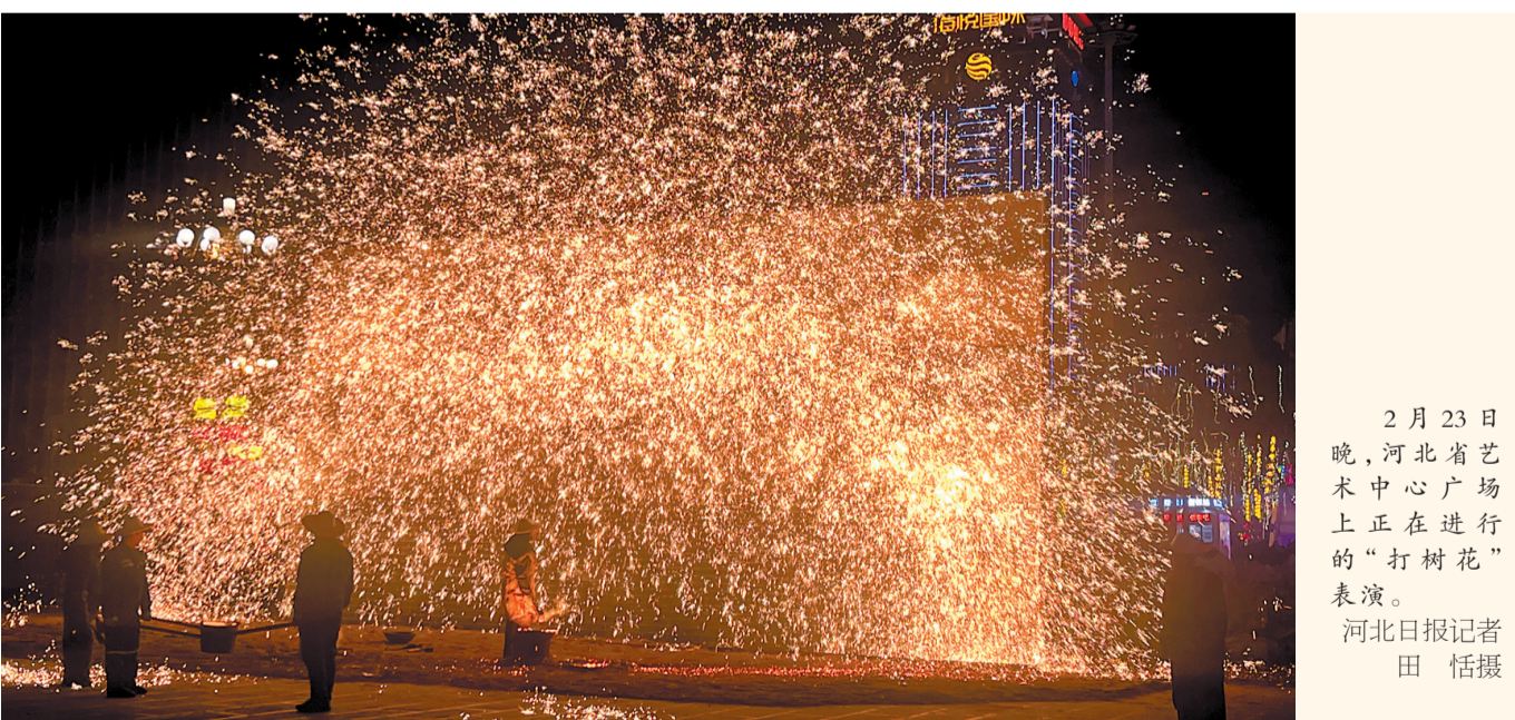
2月23日晚,河北省艺术中心广场上正在进行的“打树花”表演。

旅游时,曾去过蔚县也听说过打树花,但是遗憾没能看到,这次在家门口圆了梦,他特别高兴,“希望石家庄以后能多一些非遗民俗表演。”